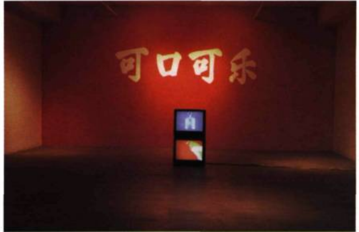
Cui Yong Jin, Made in China , 1998. Installation vidéo.

Mao Xuhui : des traits rouges, noirs, gris et blancs composent la structure du dessin, bref, la touche frise l'esquisse. La sensation qui s'en dégage est une rage, un