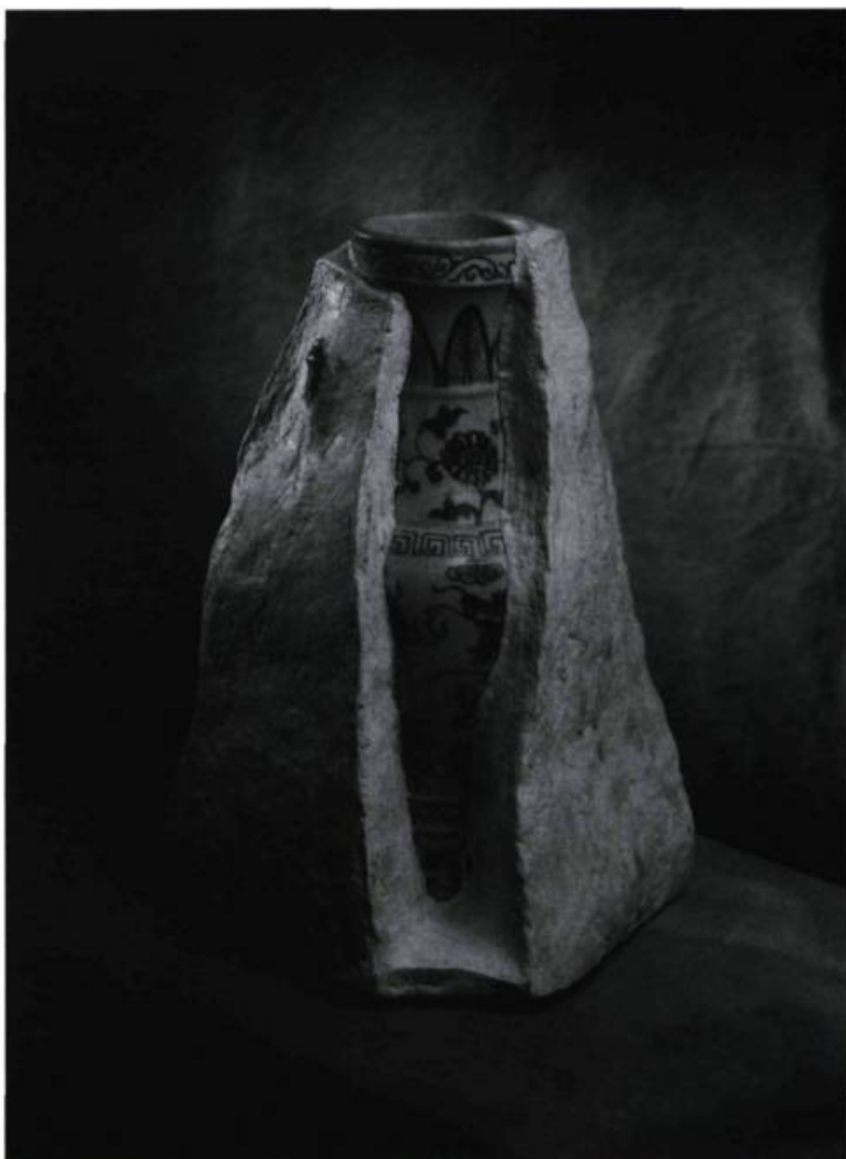
Zhang JianJun, China , # 2, 1998. Poterie antique, papier mâché; 30 x 25 x 17,5 cm.

De New York, nous assistons à une symbiose culturelle et c'est d'ailleurs pour cette nouveauté que ces œuvres sont les points forts de l'exposition. Ces artistes ne peuvent nier leurs assises culturelles chinoises et les transcendent dans un monde en transformation. Zhao Suikang s'ouvre vers un internationalisme, Zhang Hongtu et Zhang