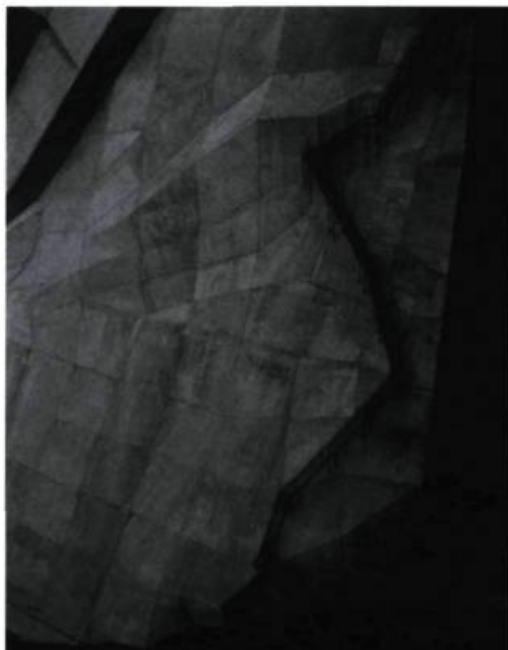
Toshio Shibata, Coolidge Dam, San Carlos, 1997 . Photographie.

Les sept cadres de ces miroirs sont tous différents : moulures rondes, carrées, petites frises en stuc, simple