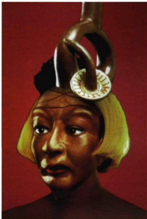
Orlan, 1998. Photographie cibachrome.

Ceci est mon corps, ceci est mon logiciel s'applique à l'autre manifestation consacrée à Orlan : Self-hybridation 9 , ou comment continuer virtuellement l'exploration des canons de beauté possibles. Jouant des possibilités de l'image numérique, Orlan « s'hybride » avec des statuettes mayas, créant une image insolite, mêlant à des degrés divers ses traits aux déformations crâniennes, aux nez postiches, au strabisme mayas. Le résultat est assez spectaculaire, très efficace sur les grands formats (de près de 2 m de haut), moins sur les autres. Citant à la fois une tradition européenne du portrait, un traitement du fond à la Bacon et une esthétique Pop Art, Orlan apparaît, mutante, dans