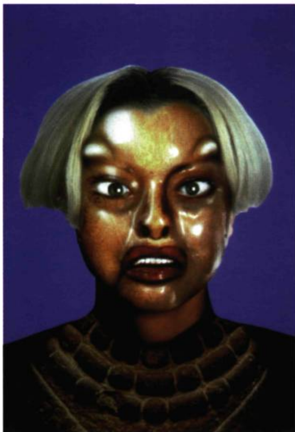
Orlan, 1998. Photographie cibachrome.

tasseau, mais apparaissent tout d'abord identiques. Leurs formes se déclinent avec un grand souci du détail. Les surfaces des miroirs sont altérées, salies, elles ont perdu leur tain par endroits. Parfois, une constellation de taches évoque la rouille ou la prolifération d'une flore microbienne.