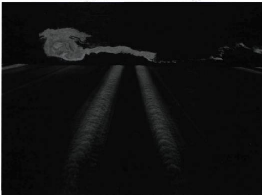
Toshio Shibata, Grand Coulee dam, Douglas County, WA, 1996 . Photographie.

formée; ce regard métamorphose le réel. Le regard du visiteur est souvent perdu : est-ce une surface, une profondeur, un plan incliné ? Les détails de ces visions épurées troublent la lecture en même temps qu'ils donnent des clés possibles. La tension et la chute sont des leitmotifs de ces vues, offrant au regard le vertige d'un abîme se dévoilant et se transformant sans cesse.