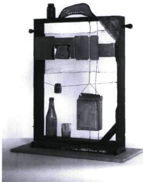
Michael Snow. Window , 1960. Bois, acrylique, polythène, verre, papier, coton, fil métallique, métal en feuille, métal en feuille chromé; 84, 4 x 77, 3 x 10, 2 cm. Collection: Musée des beaux-arts du Canada, Ottawa.

L e passage au troisième millénaire pourrait inciter plusieurs musées à reconsidérer leurs catégories temporelles; mais définir celles de la contemporanéité ne va pas sans paradoxes et difficultés. Cela pose le problème théorique sous-jacent à tout débat épistémologique sur la périodisation en histoire : quels sont les critères de son commencement et de sa fin ? S'interroger sur la limite temporelle de la contemporanéité s'avère pertinent, non seulement en regard des changements temporels induits par la mouvance du présent, mais aussi dans la foulée d'un questionnement critique des pratiques muséographiques actuelles en ce qui a trait à la constitution d'une collection d'art contemporain. Il s'agira ici de présenter un portrait général de la question, illustré de quelques cas de pratiques muséales.