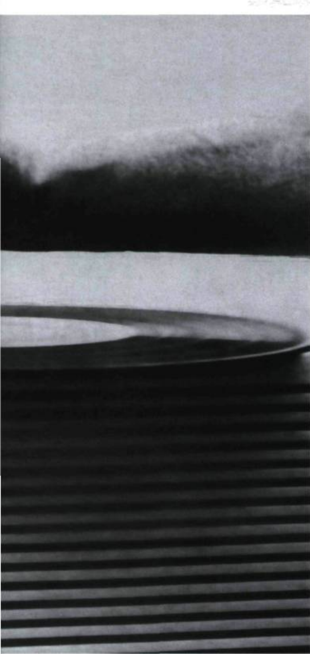
Vasilij Kamenskij, Poésie sonore .

la « nature originelle » doit néanmoins, selon eux, être gardée à distance. On constate en effet que les critiques de la musique savante ne sont pas plus en mesure d'étayer leur critique de la musique populaire 8 . La musique qu'ils chérissent est la musique naturelle drapée d'une forme de sophistication. Mais si on demande à ces critiques assurés de la vulgarité de la musique populaire et de l'excessivité de la musique savante en quoi consiste cette sophistication idéale, on constate qu'ils ne peuvent la penser autrement que comme le fruit d'une individualisation exacerbant les détails des œuvres, individualisation dont la « liberté » n'est considérée légitime que parce qu'elle maintient intactes des formes dont la contingence est promue au rang d'absolu. Il s'agit là d'une écoute moulée par ce qu'Adorno a appelé la musique « standardisée », écoute qui embrasse toutefois la « Grande musique » déchirée en lambeaux, en « hit songs ». Les éléments de liberté reconnus dans la musique savante occidentale par le philosophe sont bel et bien trahis : la totalité formelle, en quelque sorte promue par l'écoute elle-même au rang d'absolu, fait disparaître la fragilité immanente de sa contingence, et le principe d'individualisation que l'auditeur prétend découvrir dans la