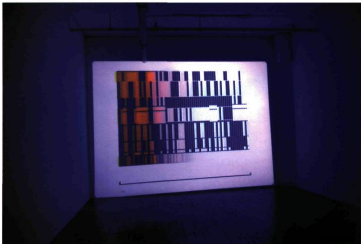
Michel Desrochers, Borderlines: Structures de l'aube , 1999. Installation- ordinateur, durée illimitée, 3 programmes en alternance.