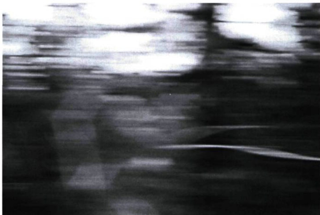
Manon Blanchette, Tracking , 1999. Extrait de la vidéo.