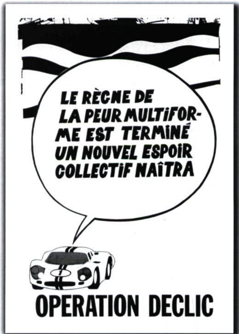
Gilles Boisvert, Affiche Opération Déclic , 1968. Sérigraphie sur papier, 60 x 40 cm env. Collection de l'artiste.

Expositions collectives, Déclics. Art et société. Le Québec des années 60 et 70 , Musée de la civilisation, Québec, du 26 mai au 24 octobre 1999. Musée d'art contemporain de Montréal, du 28 mai au 10 octobre 1999