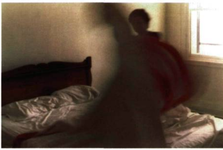
Sorel Cohen, Le rite matinal , 1977. Photographie en couleur. Collection de l'artiste.

dérision du clergé, la défense d'une langue, le français, une lutte contre un certain colonialisme qui néglige le patrimoine national et a étouffé, jusqu'alors, les avant-gardes. En réaction contre les valeurs bourgeoises, conservatrices et méprisantes, un lien avec la culture populaire sera franchement revendiqué par les artistes.