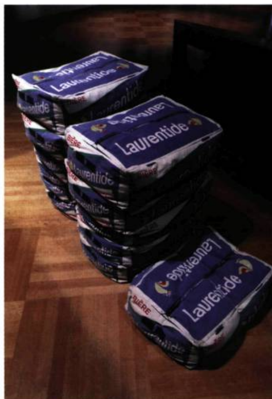
Pierre Ayot, Caisses de Laurentide , 1979-80. Sérigraphie.