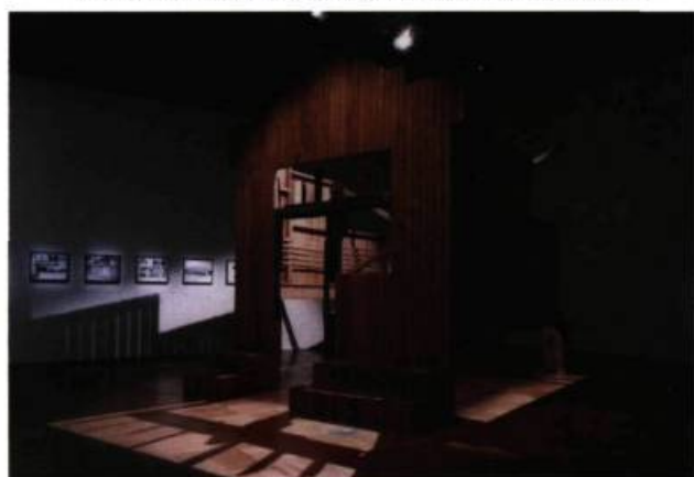
Melvin Charney, Le trésor de Trois-Rivières , 1975. Coll. Musée des beaux-arts du Canada, Ottawa.