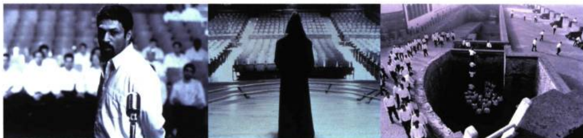
Shirin Neshat, Untitled (Turbulent Series) , 1998. Photographie en noir et blanc; 28 x 35, 6 cm. Édition de 10 + une épreuve d'artiste.

Shirin Neshat, Carnegie International , Carnegie Museum of Art, Pittsburg. Du 6 novembre 1999 au 26 mars 2000