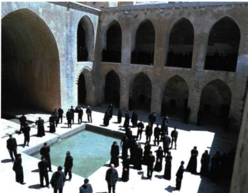
Shirin Neshat, Soliloquy , 1999.

Par ailleurs, les légendes et les mythes font souvent référence à la voix comme instrument de fécondation et d'inauguration 4 . Toujours selon certains mythes, elle peut également être un instrument de destruction. Si, dans Turbulent (1999), la voix possède certainement un grand pouvoir érotique, dans Soliloquy (1999), moins intense, elle occupe une position de retrait qui n'occulte cependant pas son pouvoir de pénétration. Les chuchotements, les répétitions sonores, les sons ambiants aux couleurs occi-