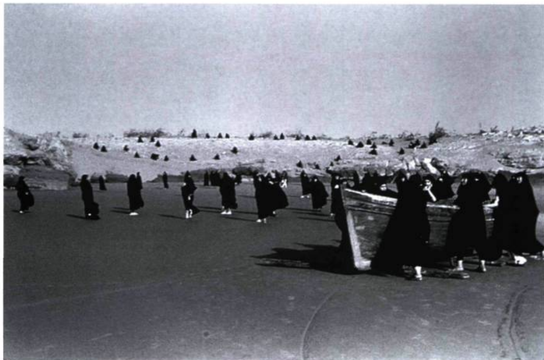
Shirin Neshat, Untitled (série Rapture - Women with Boat) , 1999. Photographie en noir et blanc, 114,3 x 177,8 cm. Édition de 5 + 2 épreuves d'artiste.

dentales, les chants religieux sont autant de traces qui renforcent le paradoxe des deux cultures représentées mais qui les traversent également par la mise en scène cohérente d'une trame harmonieuse et par moment hypnotique. En ce sens, la voix des œuvres de Shirin Neshat traverse les murs qu'elle représente, unit les espaces, les cultures et les individus, et accentue le mouvement en favorisant la compréhension de son sens métaphorique. La voix donne chair au désir de fusion.