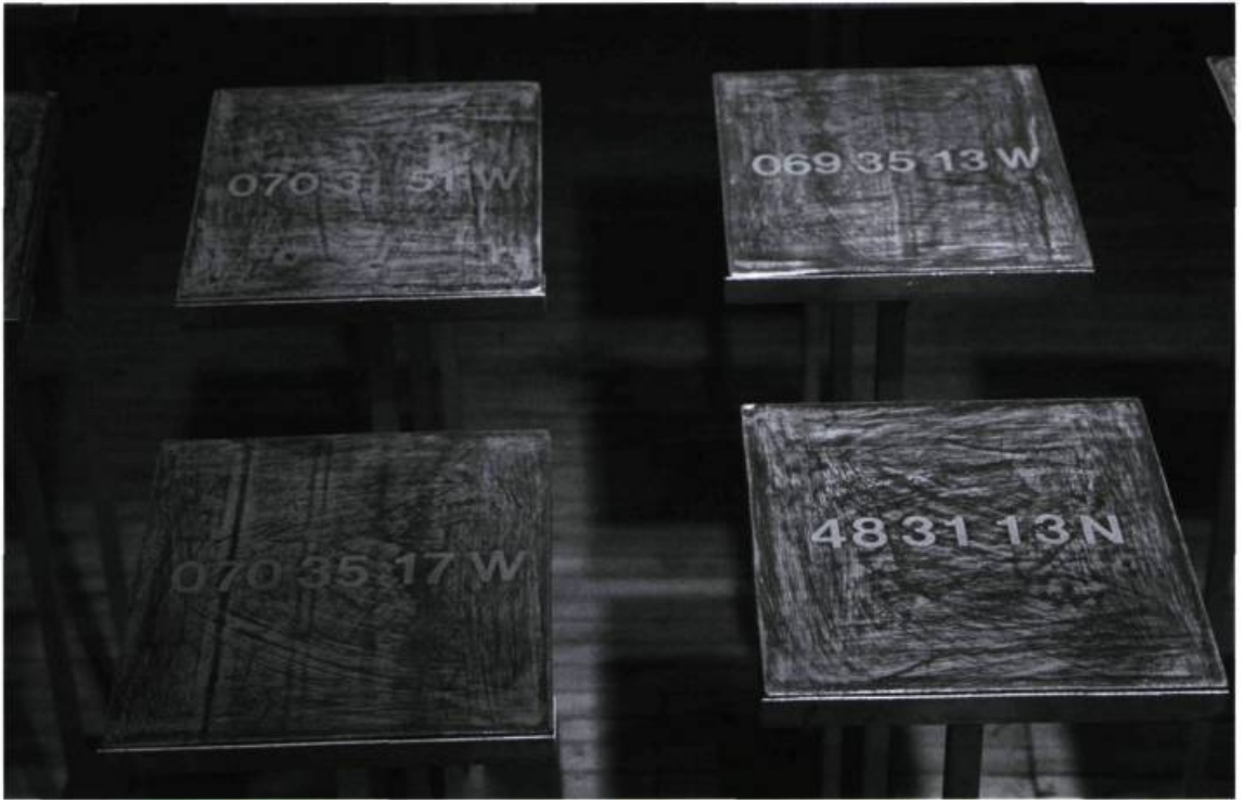
Pierre Bourgault, Musique à bouche , 2000. Installation. Circa, Montréal.

faisant fi des catégorisations lassantes en appelle-t-on, non pas tant au conte qu'à une poétisation du regard où la notion de « vérité » des choses tombe dans l'anachronisme ?