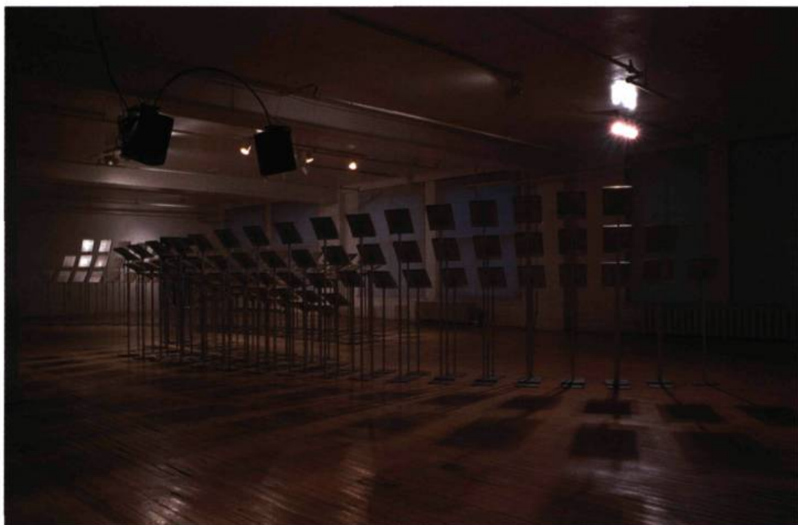
Pierre Bourgault, Musique à bouche , 2000. Installation. Circa, Montréal.

qu'à en affirmer la cohérence, telle l'action du diffracté sur la ligne de l'eau. Ainsi, l'intégration d'une parole non-intégrable connote un art possiblement non-intégrable et s'inscrit comme liberté virtuelle par rapport à toute « systématité ».