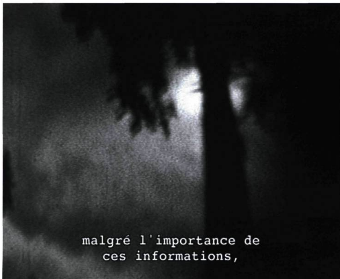
Vidéoconférence du soldat de la Wehrmacht, vers 1942.

des bricolages savants et crée des machines où des coquilles d'escargots s'animent, produisant des effets musicaux; des machines à lumières dessinent sur les murs des images en mouvement, tel un peintre invisible maniant son pinceau inlassablement sur la toile, défaisant et refaisant son travail pictural à l'infini. L'imaginaire du spectateur est convoqué de façon similaire par le dispositif de Jan Kopp. News from an Unbuilt City (1998), dans une tout autre veine, nous propose de réaliser une chorégraphie improvisée sur un échiquier sonore. L'installation se présente comme