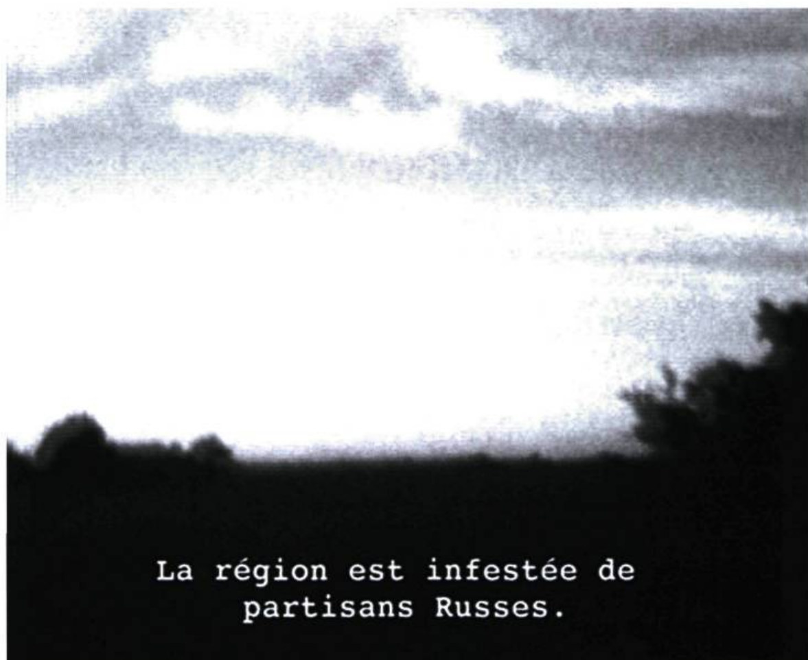
Vidéoconférence du soldat de la Wehrmacht, vers 1942.

nir l'auditeur de la lecture. L'effet captivant de l'installation est toutefois biaisé par la forte interférence que produisent les installations avoisinantes.