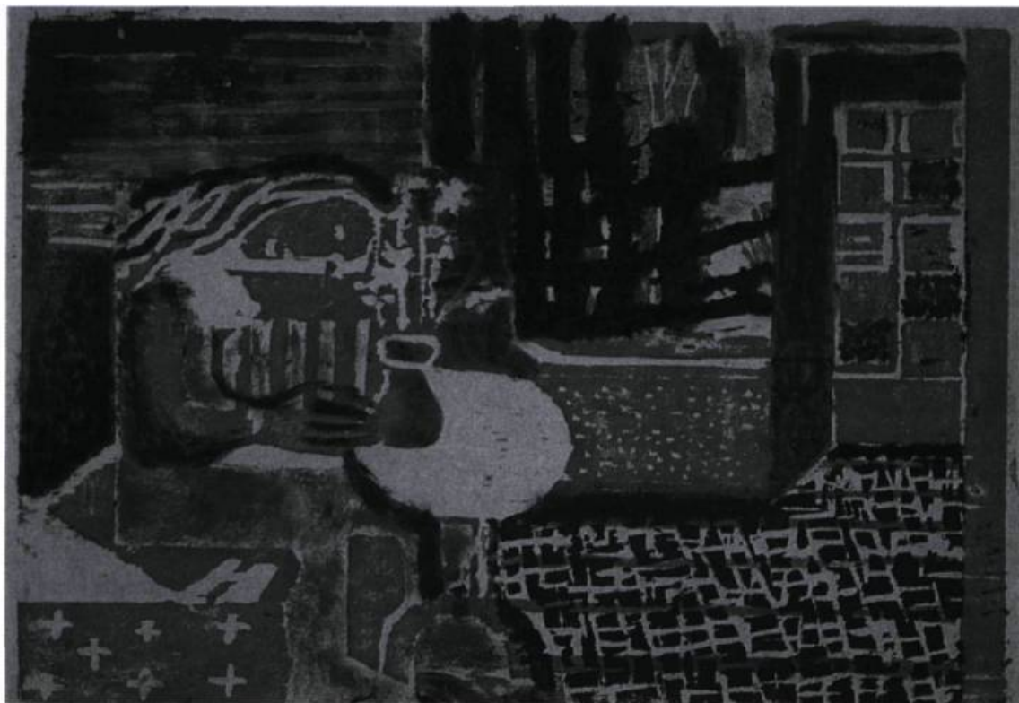
Louise Bourgeois, Le rêve , 1939. Gravure sur bois.

Il est cependant un autre aspect du commentaire de Bourgeois qui, lui, rejoint la pratique et rappelle l'image, celui du souffle des courtes phrases débitées en staccato et dont la cadence s'apparente à celle du tracé saccadé des surfaces. Dans les images de la série, les hachures sur le sol et les murs scandent l'espace en plans bien délimités et martèlent la scène dans un rythme lapidaire mais modulé d'un état à un autre, comme si par tentatives successives, l'artiste avait visé le geste juste, le mot juste... À cette époque, cherchant à se familiariser avec la langue anglaise, Bourgeois consulte les dictionnaires, fouille les encyclopédies, aspire à l'utilisation exacte des termes et des expressions, souhaite l'intégration à la terre d'accueil et, consciemment ou non, transpose ce souci de justesse dans un médium qui exige déjà une poigne vigoureuse et précise 21 . Cela sans compter que l'artiste pouvait difficilement oublier sa formation préalable en mathématiques 22 qui forme déjà à la rigueur. Bour-