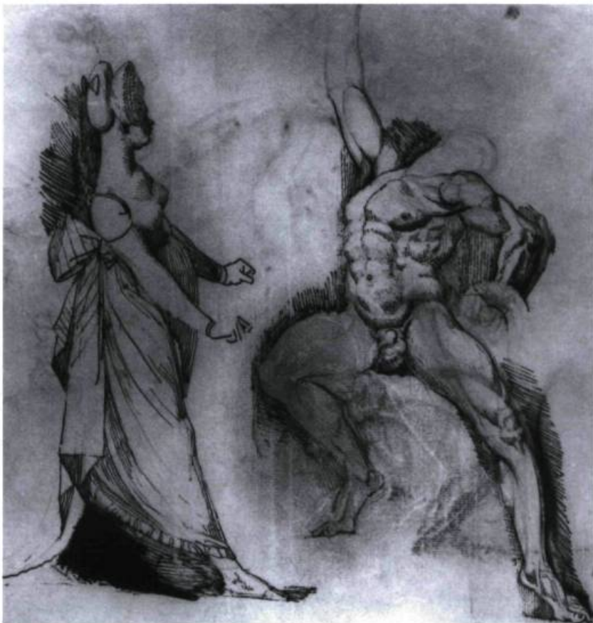
J. H. Füssli, Femme devant le Laccoon , 1801-05.

D'autres médiums qui pourtant pourraient eux aussi permettre une plus grande diffusion des images semblent avoir eux aussi été limités dans leurs usages. Dans le milieu des arts, les tirages photos se font de plus en plus en quantités limitées. Ce fut une révolution récemment lorsqu'une compagnie a réussi à convaincre des photographes de vendre en plus grand nombre (et moins cher donc) certaines de leurs images. Même la vidéo et le cinéma semblent être extrêmement contrôlés de nos jours. Matthew Barney, par exemple, présente au compte-goutte son cycle des Cremaster dans certaines villes et pour une période très limitée.