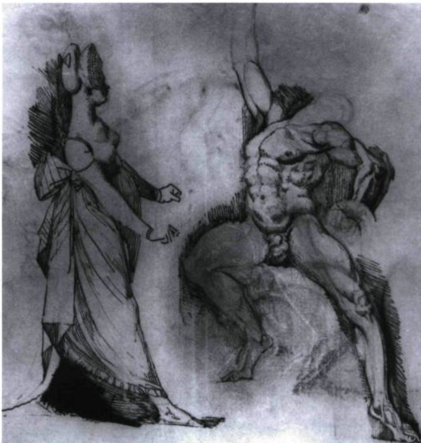
J. H. Füssli, Femme devant le Laccoon , 1801-05.

D'autres médiums qui pourtant pourraient eux aussi permettre une plus grande diffusion des images semblent avoir eux aussi été limités dans leurs usages. Dans le milieu des arts, les tirages photos se font de plus en plus en quantités limitées. Ce fut une révolution récemment lorsqu'une compagnie a réussi à convaincre des photographes de vendre en plus grand nombre (et moins cher donc) certaines de leurs images. Même la vidéo et le cinéma semblent être extrêmement contrôlés de nos jours. Matthew Barney, par exemple, présente au compte-goutte son cycle des Cremaster dans certaines villes et pour une période très limitée.