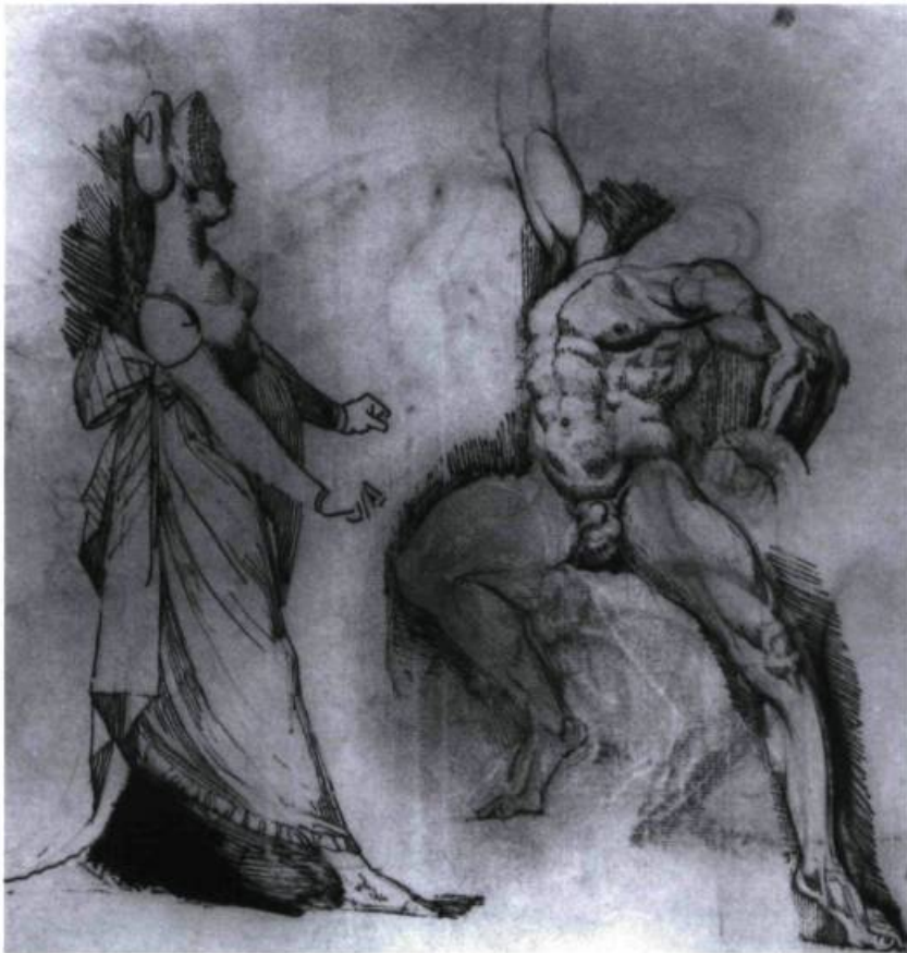
J. H. Füssli, Femme devant le Laccoon , 1801-05.

D'autres médiums qui pourtant pourraient eux aussi permettre une plus grande diffusion des images semblent avoir eux aussi été limités dans leurs usages. Dans le milieu des arts, les tirages photos se font de plus en plus en quantités limitées. Ce fut une révolution récemment lorsqu'une compagnie a réussi à convaincre des photographes de vendre en plus grand nombre (et moins cher donc) certaines de leurs images. Même la vidéo et le cinéma semblent être extrêmement contrôlés de nos jours. Matthew Barney, par exemple, présente au compte-goutte son cycle des Cremaster dans certaines villes et pour une période très limitée.