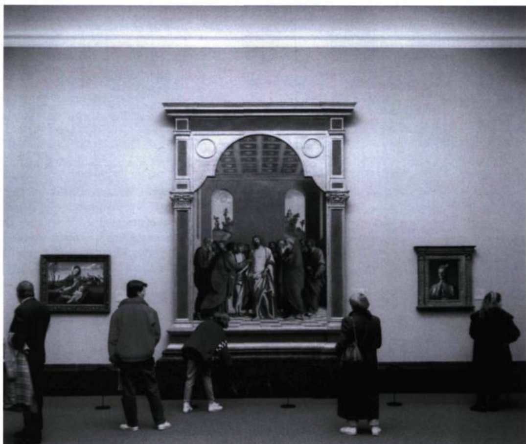
Thomas Struth, National Gallery 1, London, 1989, 1989.