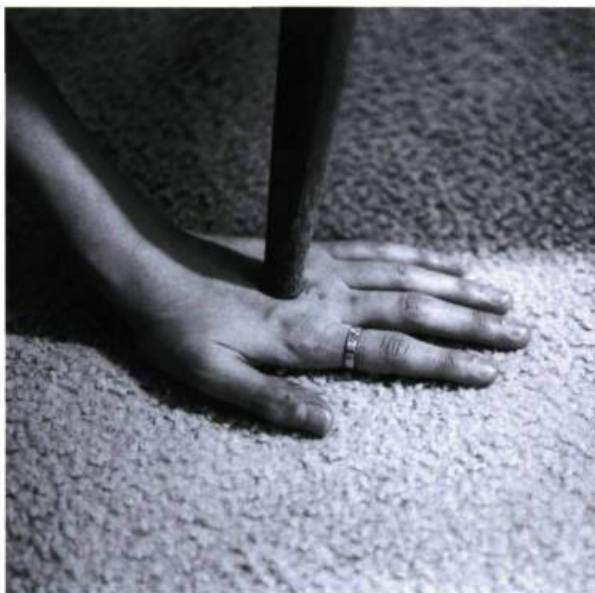
Sébastien Cliche, Accident de la vie courante , série Vivre blessé , 2001.

La démesure souvent observée dans la recherche du confort et de la sécurité anime chez l'individu une « tension sans intention », qui engendre un sentiment diffus de vulnérabilité et de méfiance pouvant aller de l'inquiétude jusqu'à la panique. Pour réagir, d'aucuns