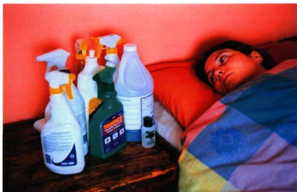
Sébastien Cliche, Trounced , série Vivre blessé , 2001.

La cuisine est un chantier fourmillant d'objets dangereux : couteaux, mixeurs, appareils de cuisson. La salle de bains offre un terrain propice aux chutes et glissades diverses; c'est pourquoi la baignoire doit être munie d'un tapis antidérapant et au minimum d'une poignée au mur afin de se prémunir contre les dérapages. On constate que les couteaux coupent, que les produits d'entretien sont le plus souvent toxiques, qu'une couverture électrique peut causer l'électrocution, un fer à repasser, une brûlure, une plante d'intérieur, un empoisonnement, un fil électrique, un étouffement, une serrure, une séquestration. On apprend que les sacs en plastique ou autres papiers d'emballage, les souffleuses à neige, les tondeuses à gazon ne sont pas, eux non plus, inoffensifs. Bref, la liste des dangers qui nous guettent dans l'ombre semble infinie. Et la maison qui, dans l'imaginaire collectif, représente un refuge chaleureux, confortable et sécuritaire pour ses occupants, devient paradoxalement un lieu de frustrations et de souffrances.