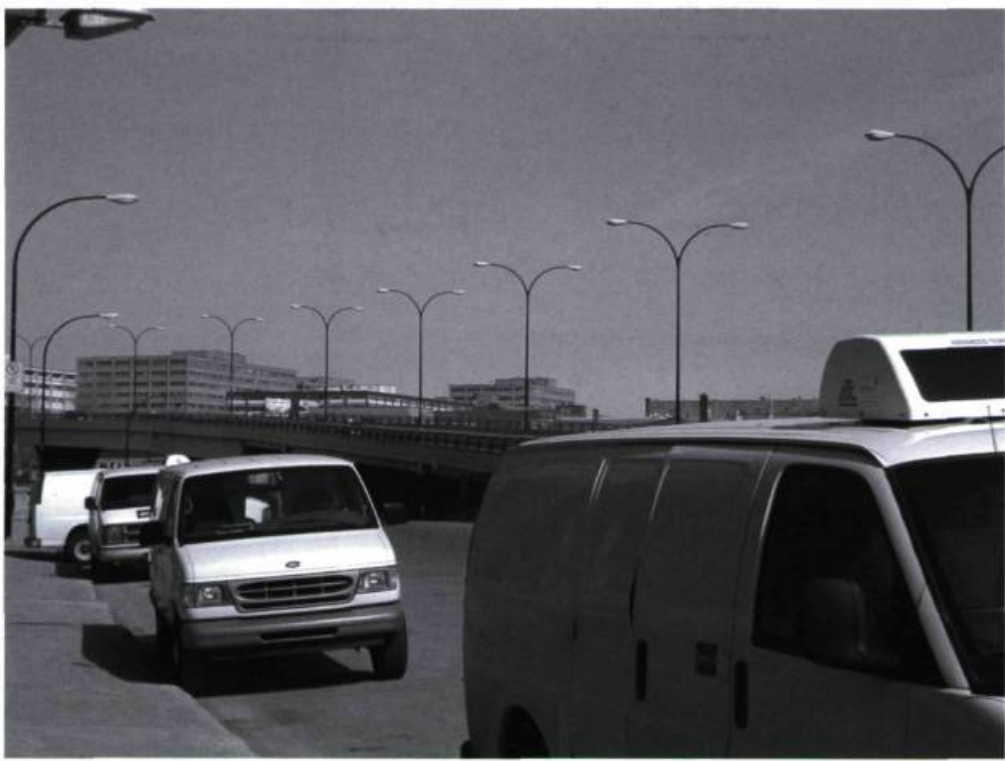
Jean-François Prost, Camouflage, camion générique. Station 10 - Walmart, Granby, Québec, 05/16/2002, 2002.