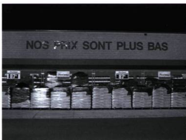
Jean-François Prost, Station Loblaw's, Nos prix sont les plus bas, 2002.