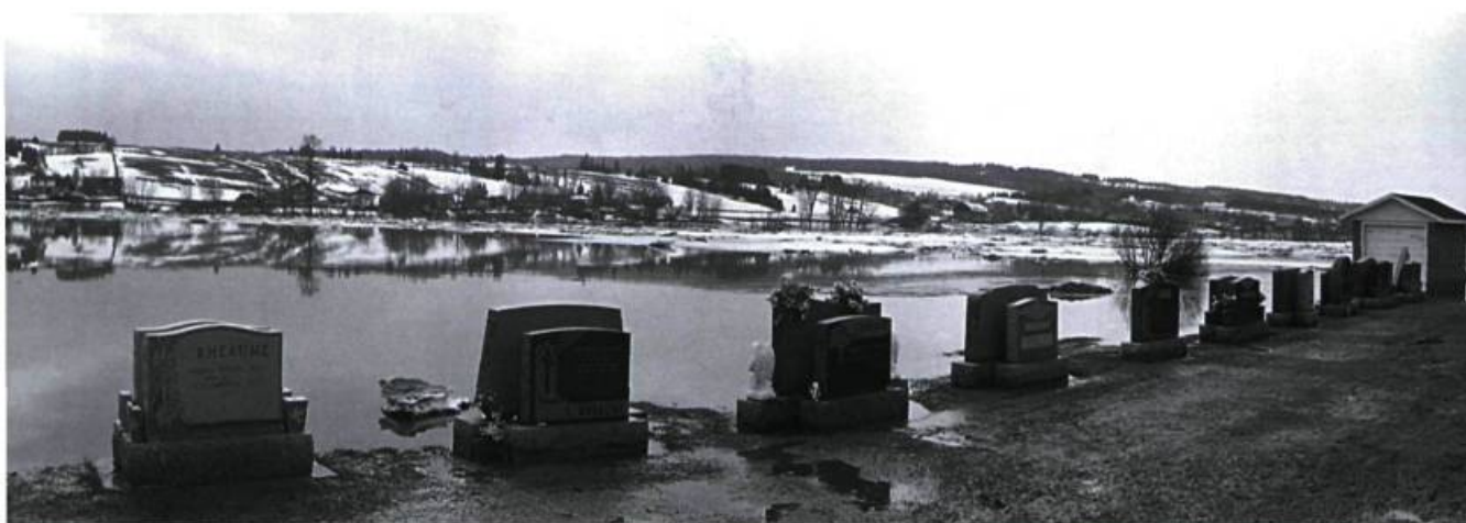
Ivan Binet, Repos , 2002. Photographies diptyque; 30 x 95 cm.

rizon, parce qu'elles sont en noir et blanc, ces photos semblent plus proches du genre conventionnel qu'est le paysage. Voire !