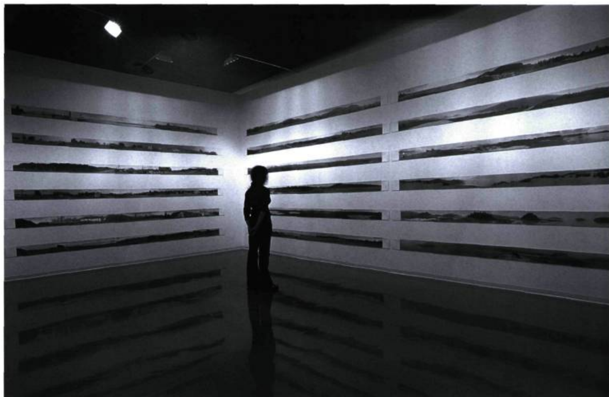
Ivan Binet, Répertoire d'horizons , 2002. Vue d'ensemble.

contestables, géographiquement. Et on hésite! Est-ce là l'effet des occupations irraisonnées de territoires, par des humains squattant grossièrement, en des lieux qui conviennent mal à ce qu'on y plante ? Ou devons-nous croire à une intervention de l'artiste qui enfile les uns à côté des autres des éléments difficilement conciliables ? Il en va certainement de l'une comme de l'autre de ces possibilités. Les paysages paraissent définitivement trop devoir s'étendre jusqu'à l'infini et déborder la ligne d'horizon qu'ils semblent suivre scrupuleusement.