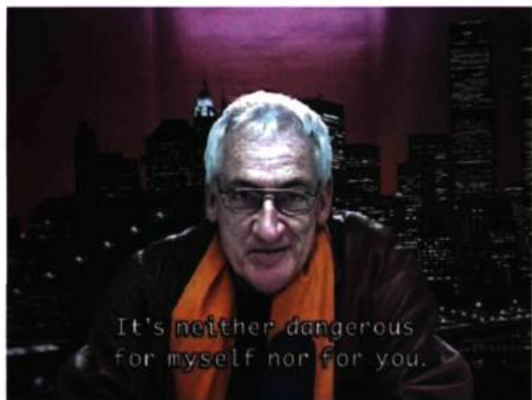
Élodie Pong, Secrets for Sale , Vidéo, 2003.

La vidéo est littéralement ce qui permet ces deux propositions, leur condition initiale : il y a eu confession