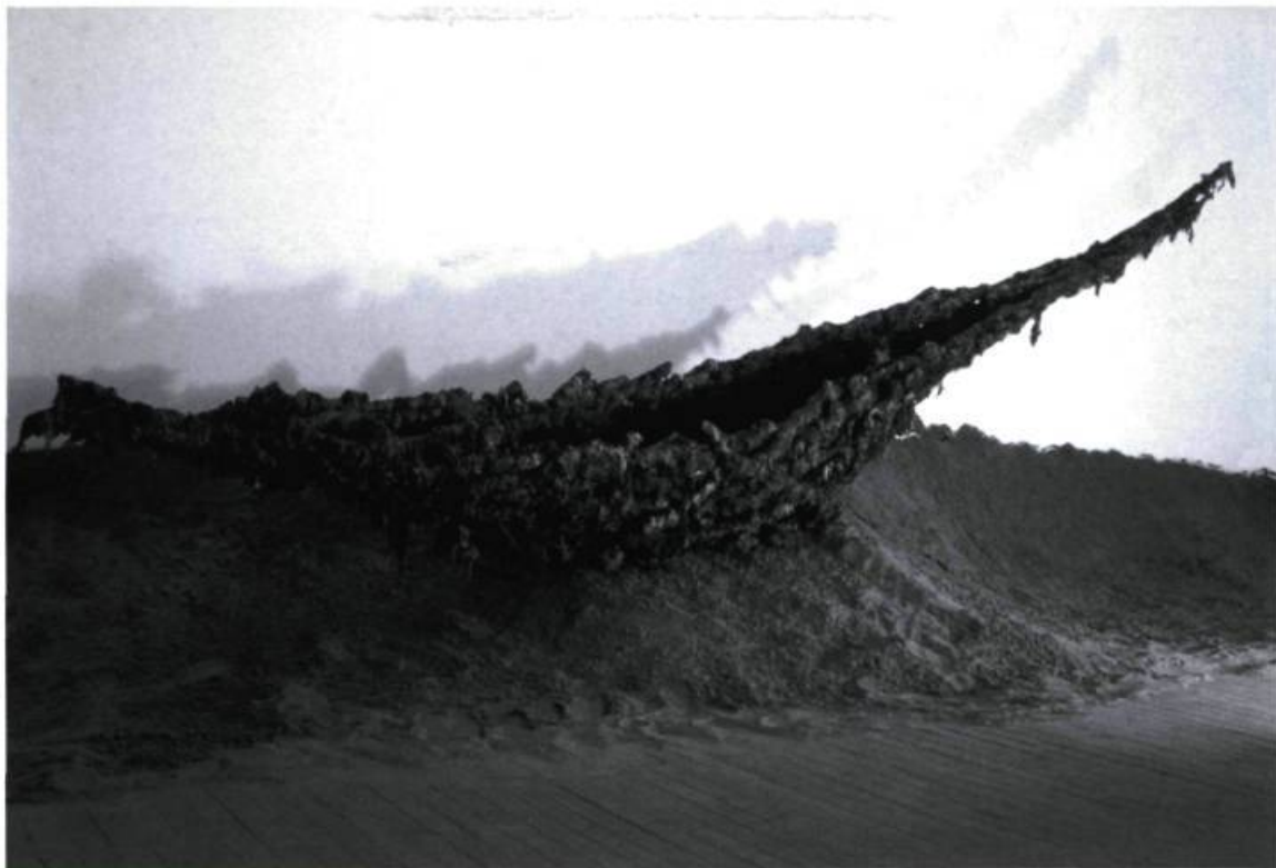
Michelle Héon, Barque funéraire , 1993. Installation Temps, espace, déplacement. Galerie Trois Points, Montréal.

dans la catégorie « textile » : le fil, le tissu incluant les fibres végétales, animales, synthétiques et artificielles, les fils métalliques, les tubulures plastiques, les lanières de cuir, les languettes de bois, les bandelettes de papier et la fourrure 8 . À ce compte, les sculptures d'organdi cousu de Stephen Schofield (dont la présence au colloque « Toutes tendances textiles » était grandement significative) et les architectures liquides de Michelle Héon peuvent être rangées dans la catégorie « arts textiles ». Il vaudrait donc mieux parler de fibre et non de textile qui est, par définition, une « matière propre à être tissée ». La fibre, assure le dictionnaire, désigne, quant à elle, toute matière filamenteuse de forme allongée, d'origine naturelle ou non, qui entre dans la composition d'un corps ou d'un objet. Entendue en ce sens, la fibre participe à l'extension infinie de l'art, à « l'artialisation » 9 consciente et généralisée du monde. Elle était déjà à l'œuvre dans les sculptures molles de Claes Oldenburg, les feutrinnes suspendues de Barry Flanagan, les enveloppes de Christo, les panneaux de Robert Morris, les rituels de Joseph Beuys, etc. 10 Elle s'est subrepticement infiltrée dans tous les interstices de l'art sans pour autant être explicitement nommée. 11