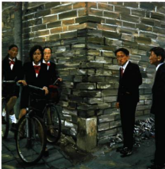
Liu Xiaodong, Trough the ages, heroes have come from the young, 2000. Huile sur toile; 200 x 200 cm. Collection YQK Art Center Pekin, Chine.

conceptuels, Song Dong et Yin Xiuzhen, s'associant au cinéaste Wu Wenguang, mêlent installations, vidéos, musique, acteurs, danseurs professionnels et travailleurs migrants (« Dancing With Migrant Workers » (2001). Bref, tout que j'apprenais de ce catalogue, « pavé rouge », boîte à double fond explosif en regard duquel l'exposition me parut presque fade, s'assimilait (à quelques spécificités près) au climat que j'avais connu dans l'Italie des années 70, que d'autres vécurent durant l' Underground des années 60-70 à New York. Or qui nous parla à l'époque de la Chine en ces termes ? Quelle distance