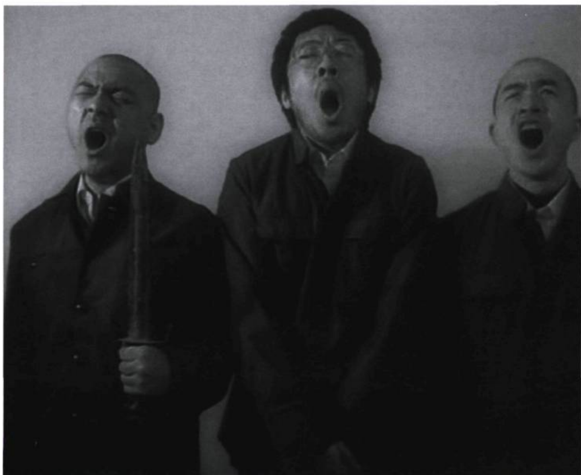
Yang Fudong, Backyards. Hey, Sun is rising , 2001. Vidéo 13 minutes. Collection de l'artiste.

une traînée de poudre l'autre moitié du monde : Berlin, Venise, Kassel, Vienne, São Paulo, New York, Paris (consacrant, en 1995, une musique expérimentale encore non grata à Pékin). Mais c'est surtout en 1999, à Brisbane, que se tient la Troisième Triennale Asie-Pacifique exhibant un art asiatique authentiquement contemporain, dialectiquement arc-bouté entre artefacts archaïques (ou « premiers ») et ellipses minimalistes, avec pour médium de choix : l'installation 5 . Se noueront aussi des liens au plan régional : Japon, Taiwan, Corée. Audacieux, ces artistes semblent avoir réinvesti des réflexes collectivistes en solidarités artistiques, les fédérant tant au plan diasporique que national. « Consulter Products Series », du groupe « Nouvelle Histoire », s'improvise dans le McDonald's d'une artère de Pékin (1993). La