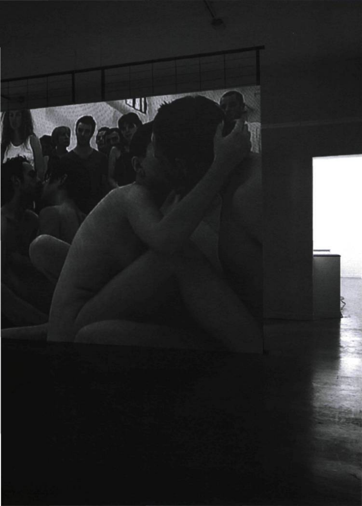
Adel Abdessemed, Real Time , 2003. FRAC de Champagne-Ardennes.

frer, que l'histoire de l'art a posé sur de telles visions d'innocence. En effet, comme les sujets récurrents de ces œuvres sont ceux des rapports du corps envers les contraintes de la culture, de la religion, de la politique, aussi troublants demeurent ces liens tissés avec la tradition picturale. Situées quelque part entre l'enregistrement d'instant fugitifs et subversifs où basculent le quotidien et le statut pérenne d'icônes de libération, les visions d'Adel Abdessemed trans-