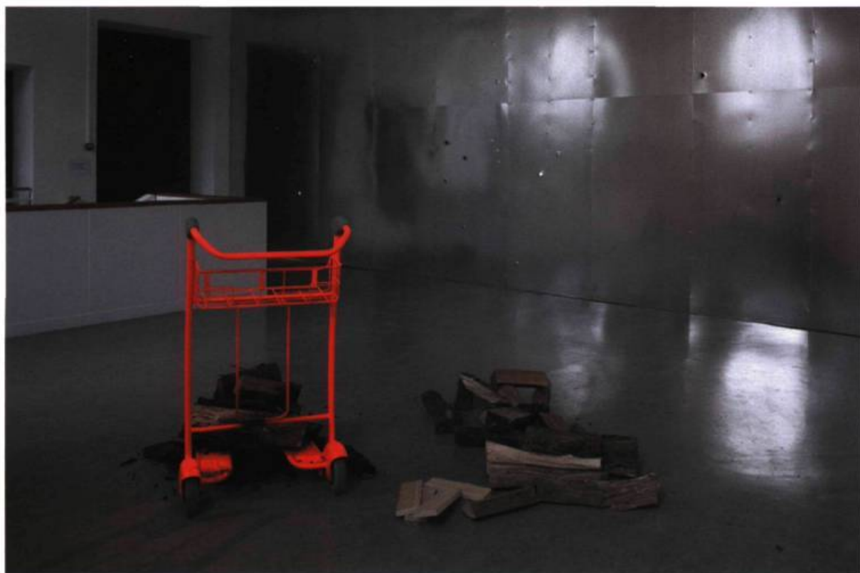
Adel Abdessemed, Habibi , 2004. FRAC de Champagne-Ardennes.

On rejoint ici l'une des grandes caractéristiques des œuvres d'Adel Abdessemed. Entrecroisant métaphores et références historiques, elles s'ancrent également à des éléments puisés à la biographie, à l'identité culturelle même de l'artiste ou de leurs participants. Elles s'attaquent aux diktats, aux tabous, aux interdits sociaux ou religieux auxquels elles opposent la vérité indestructible du plaisir. Une autre vidéo, Passé simple (1997), montrait des femmes et des hommes dansant nus sur des tables, s'accompagnant au moyen de tambours et trompettes. Les prises de vue accentuaient le caractère mythologique « païen » et les racines méditerranéennes de cette scène, au détriment des préceptes d'une intransigeance religieuse pour laquelle les intégristes musulmans n'ont pas le seul monopole. Dans Joueur de flûte (1996), un religieux