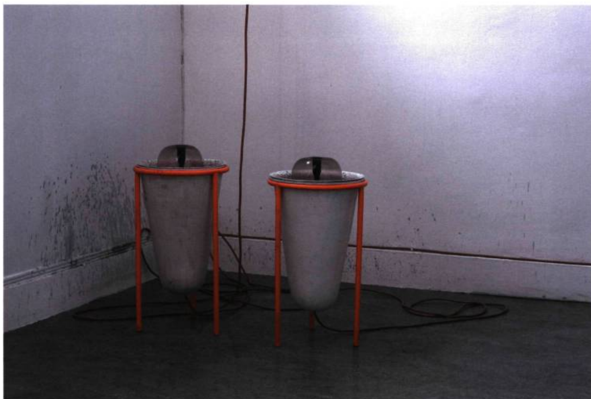
Adel Abdessemed, Habibi , 2004. FRAC de Champagne-Ardennes.

retombent comme toujours sur leurs pattes et lapent leur bol. Ils foulent un sol bleu cobalt, trop heureux de ces nourritures terrestres, tandis que le squelette préhistorique planant au-dessus d'eux introduit une sorte d'opposition où se résume en deux images la condition humaine selon Abdessemed. Lapent les chats. Comme ces animaux affamés, l'artiste trouve sa nourriture, son inspiration, où il le peut. Il attend, suspendu, que la chair anime le squelette des idées humaines et fasse corps, s'imposant au visiteur en une suite de contrepoints subtils.