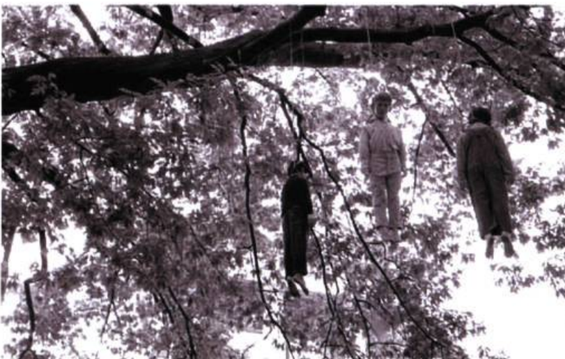
Maurizio Cattelan, Enfants perdus , 2004.