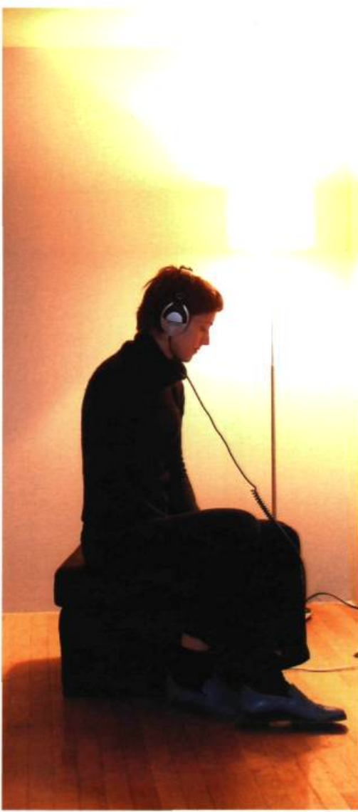
Patric Lacasse, Pavillons mitoyens, 2005. Bois, gyproc, laine acoustique, latex, vidéo DVD, son ambiant et stéréo; 213 x 305 x 570 cm.

sement ciselés affiche une élégance frêle. On songe à des jouets curieux et rares, à des tambourins amérindiens. Ces maquettes architecturées pourraient aussi revendiquer de lointaines origines constructivistes. Ce sont aussi des capteurs qui effectuent la cueillette du moindre déplacement d'air. Comme une peau qui réagit au plus petit souffle, à l'intimité d'un contact, au frôlement d'un passage, une présence mouvante nous est restituée et est répercutée à la surface d'une sculpture tambour, plus grande, posée au sol, au centre de la pièce. Les stimuli sonores la font vibrer tandis que s'entrechoquent, systoliques, à sa surface, de petites pierres.