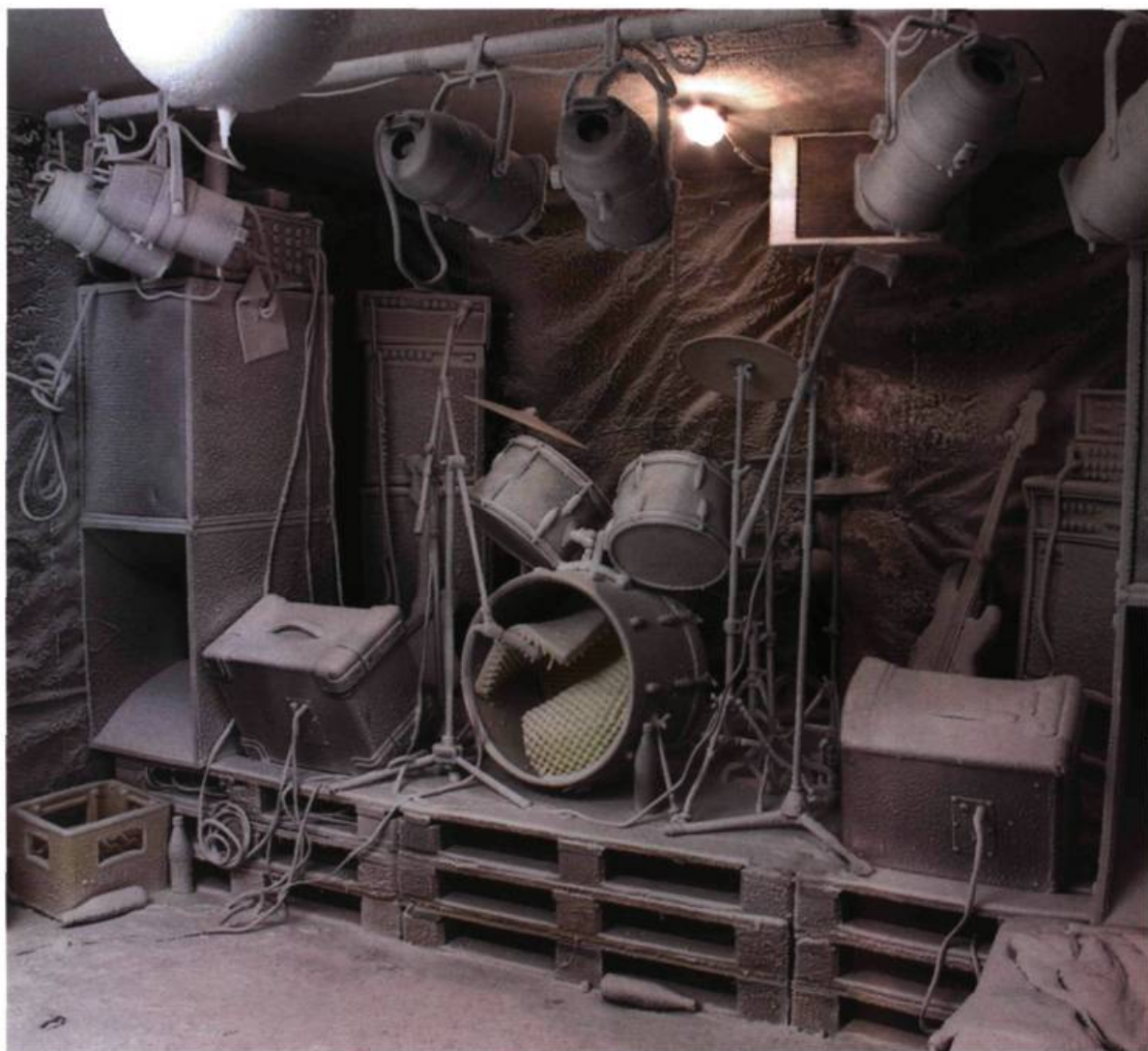
Christoph Büchel, Minus , 2002. Concert et installation, Zürich, Migros Museum für gegenwartskunst Zürich. © Christoph Büchel et Migros Museum für gegenwartskunst Zürich.

ampoules se balançant dans la vapeur. Dans un style quasi-clownesque, il nous fait entrer dans l'abîme des fables propres aux sociétés industrialisées avec leurs promesses utopiques.