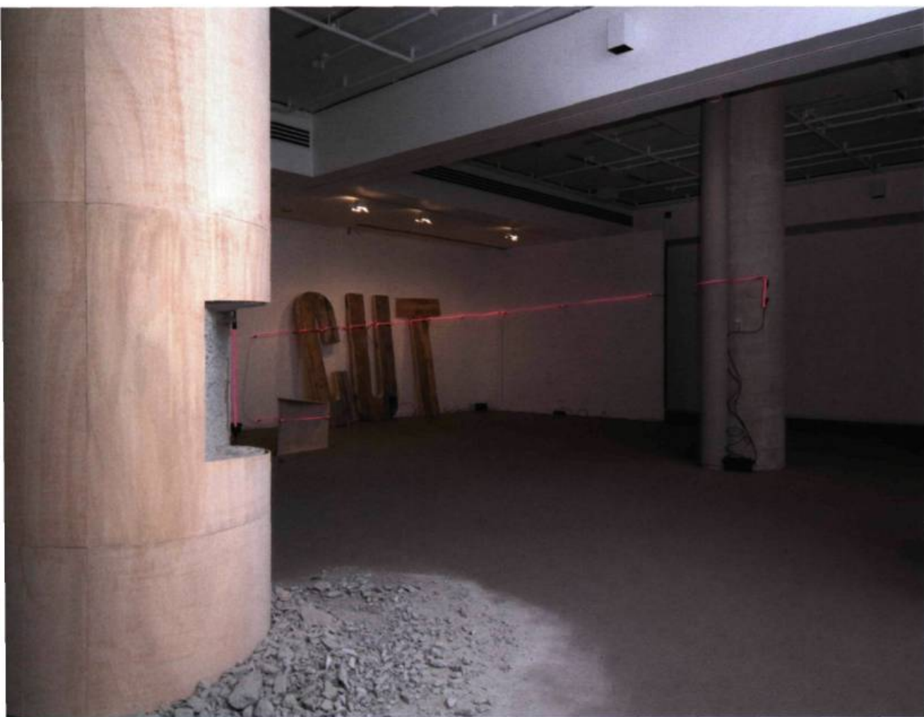
Peter Gnass, C for CUT , 2004. Installation à la Galerie de l'UQÀM.

un rôle qui tienne davantage compte (en plus de leur activité de collectionnement) du contenu politique des œuvres 12 , Jean-Marc Poinsoit écrit : « Une iconologie de l'art contemporain devrait à partir de ses matériaux et de ses méthodes propres pouvoir élaborer des objets intermédiaires entre les effets du libre arbitre des artistes et les grands récits du politique dont les inventeurs de la postmodernité ont fait leur deuil 13 . » Voilà déjà un deuxième aspect du modernisme qui mérite, en regard de la sculpture contemporaine, une plus importante réflexion.