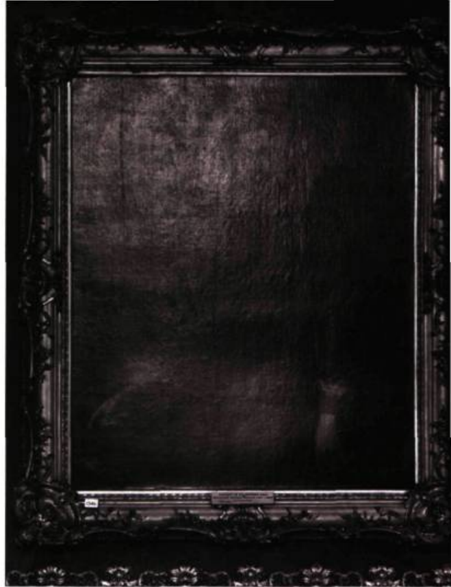
Yuji Ono, Murillo .

Par nature outil d'une apparition, la photographie peut donc être envisagée, a contrario , comme l'acteur ou le témoin d'une disparition. Dans une optique de prime abord documentaire ou muséologique, le japonais Yuji Ono photographie, depuis 1995, encadrément compris, des toiles de maîtres des XVII e , XVIII e