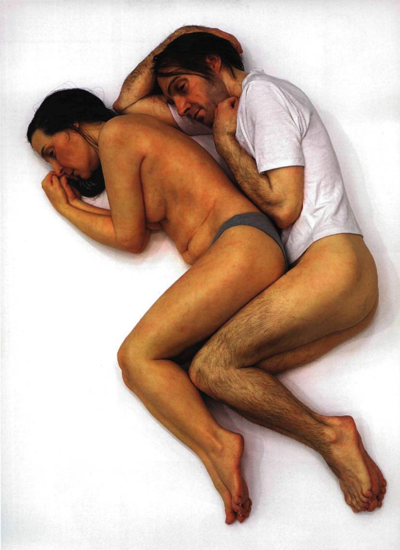
Ron Mueck, Couple couché en cuillères , 2005. Matériaux divers; 14 x 65 x 35 cm. Coll. Scottish National Gallery of Modern Art, Édimbourg.