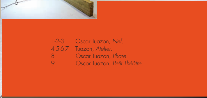
1-2-3 Oscar Tuazon, Nef . 4-5-6-7 Tuazon, Atelier . 8 Oscar Tuazon, Phare . 9 Oscar Tuazon, Petit Théâtre .