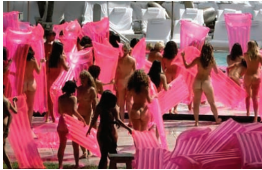
Spencer Tunick, Miami 2 .