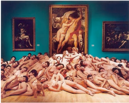
Spencer Tunick, Düsseldorf 4 (Musée Kunst Palast) , 2006.