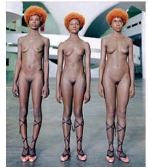
Vanessa Beecroft, VB50.005.DR , 2002-2003.