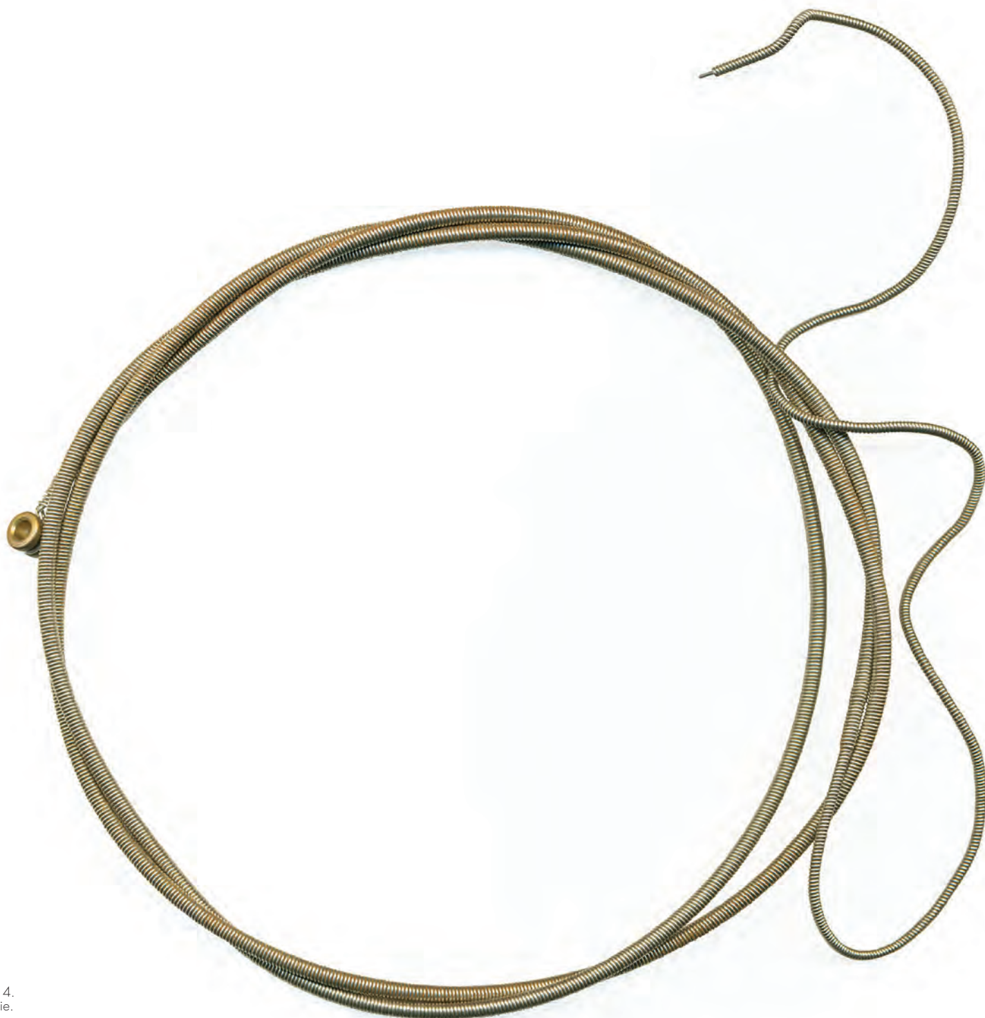
Sébastien Pesot, Bling 2 , 2014. Installation vidéo. Photographie.