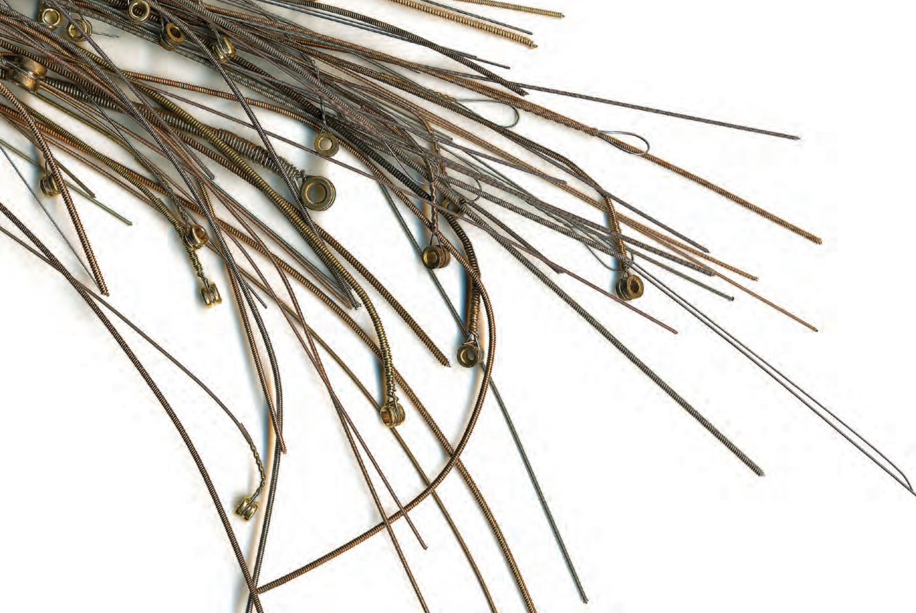
Sébastien Pesot, Bling 1 , 2014. Installation vidéo. Photographie.