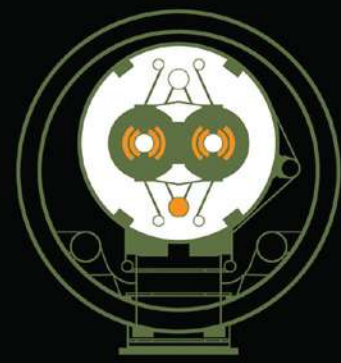
AUDIINT - 3 Turntable Phases de Toby Heys et Steve Goodman. De gauche à droite : Two-Ring Table, Yinyang Table, Large Hadron Collider Image : gracieuseté des artistes, 2014.