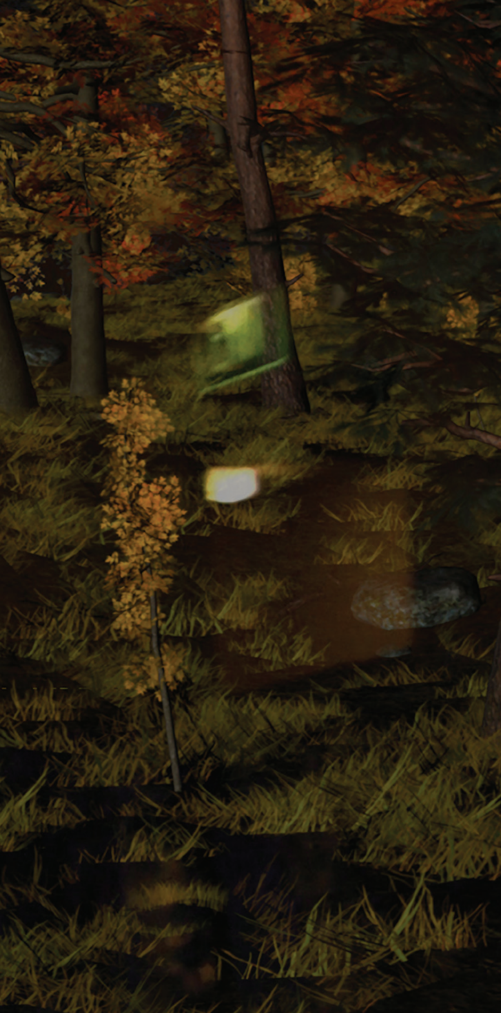
Lizzie Fitch / Ryan Trecartin, Site Visit , 2014. Extraits vidéo. Courtoisie des artistes et de Andrea Rosen Gallery, New York; et Regen Projects, Los Angeles; et Spruth Magers, Berlin, Londres.