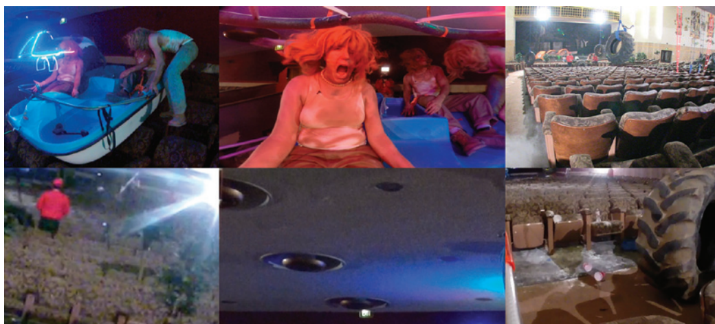
Lizzie Fitch / Ryan Trecartin, Site Visit , 2014. Extraits vidéo.