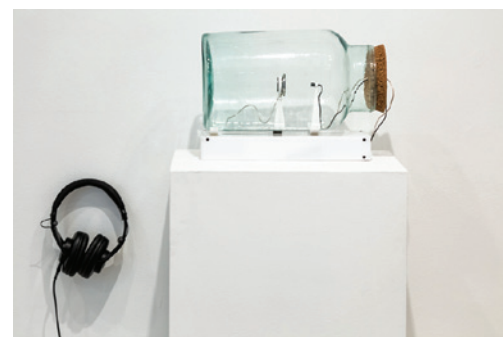
Adam Basanta, Vessel 2 , 2015.

La première pièce présentée est sans doute celle qui donne son nom à l'exposition. À moins, évidemment, que ce ne soit l'inverse. Il s'agit de sept haut-parleurs dépouillés, simples cônes tournés vers le haut, disposés en rond autour d'un micro monté sur un trépied dont le bras est orienté de manière à pointer vers les haut-parleurs. Comme ce dernier dispositif est monté sur un piédestal animé par un moteur lui donnant un mouvement de rotation, il vient un moment où le micro se trouve à pointer directement vers un des haut-parleurs. Ce changement constant et mesuré de position en vient donc à créer des tonalités sonores, variables au gré des passages devant les haut-parleurs. Neuf rotations complètent un cycle au cours duquel on entendra une version