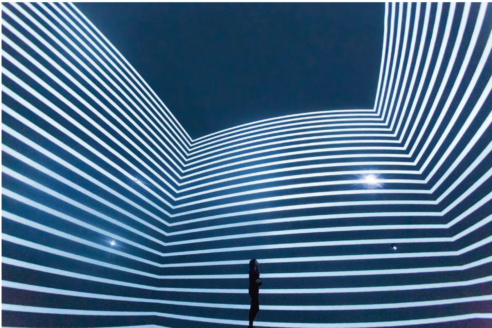
Nonotak, VERSUS, 2015-2016. Satosphère, SAT – Société des arts technologiques, Montréal.

s'allonger vers le haut. Le spectateur a l'impression d'être emprisonné – à nouveau – par une clôture dont la hauteur et l'orientation (les lignes se balancent de gauche à droite) ne cessent de varier avec rythme de la musique. Après quelques minutes, un effet intéressant se produit : les lignes se segmentent soudainement en plusieurs petites sections de longueur identique qui commencent à tourner sur elles-mêmes. L'ordre dans lequel ces sections bougent alterne de manière à rappeler l'ondulation que produit une goutte d'eau quand elle tombe sur une surface liquide – ce qui établit un lien avec les mouvements hypnotiques des cercles. Enfin viennent les cubes.