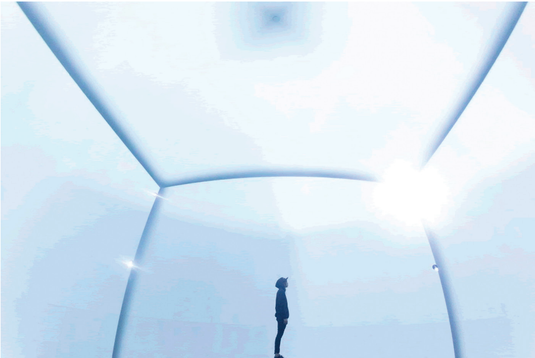
Nonotak, VERSUS, 2015-2016. Satsosphère, SAT – Société des arts technologiques, Montréal.

abstraite et électronique martèle le rythme régulier et incessant de ce mouvement. Elle garde le spectateur en alerte tout en lui donnant une étrange sensation de réconfort.