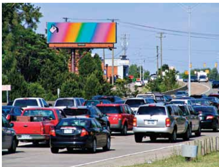
Anthony Antonellis, paint_bucket_landscape.gif , 2012. GIF Animé sur panneau d'affichage LED. Avec l'aimable autorisation de l'artiste. © Photo : Justine Tobiasz.

Les artistes ont embarqué, et on s'est retrouvés avec une belle équipe dont Morehshin Allahyari, Anthony Antonellis, LaTurbo Avedon, Jeremy Bailey, Brenna