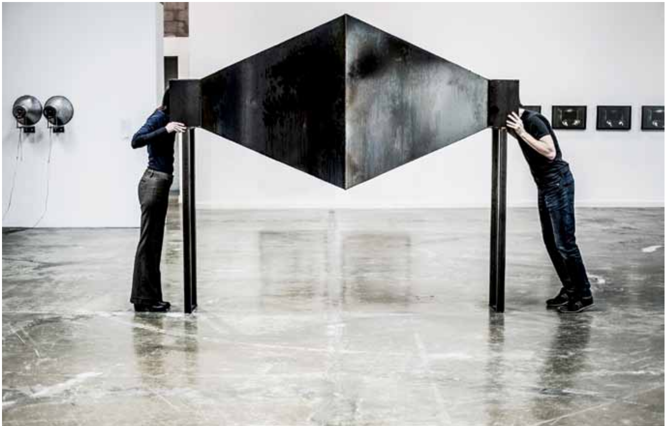
Dominique T. Skoltz, y2o - Face à face [série Dialogues] , 2015. Installation en acier ; 223.5 x 274.3 x 121.9 cm. 29 min 22 sec.

Avec y2o , l'artiste pluridisciplinaire Dominique T. Skoltz poursuit sa visée polymorphique et se démarque tant dans les festivals numériques que les espaces d'exposition 1 . Dans le cadre de la récente exposition au centre Arsenal art contemporain de Montréal, le film devient corpus par le biais d'éléments satellites tels que sculpture, objet performatif, tirage argentique et film-installation. Huis clos mené sous l'eau et divisé en neuf actes, y2o capte l'attention du visiteur en le soumettant au décryptage de divers fragments de discours amoureux 2 qui se font écho et s'entrechoquent en temps réel. Au gré de neuf écrans, deux protagonistes 3 sont mis en lumière – pour le meilleur et pour le pire – selon les neuf mouvements suivants : 01_link, 02_nœuds, 03_nerfs, 04_bulles de silence, 05_ce mortel ennui, 06_SMS, 07_unlink, 08_lâcher prise, 09_empty. Les tableaux vivants s'y manifestent sur fond de blanc pur, puis se cristallisent sur des fonds noirs oxydés 4 qui soulignent la matière et les symboles de la mise en eaux troubles. Cette palette étendue de micro-inductions produit inexorablement un effet de larsen épidermique 5 qui s'intensifie jusqu'à un point de non-retour.