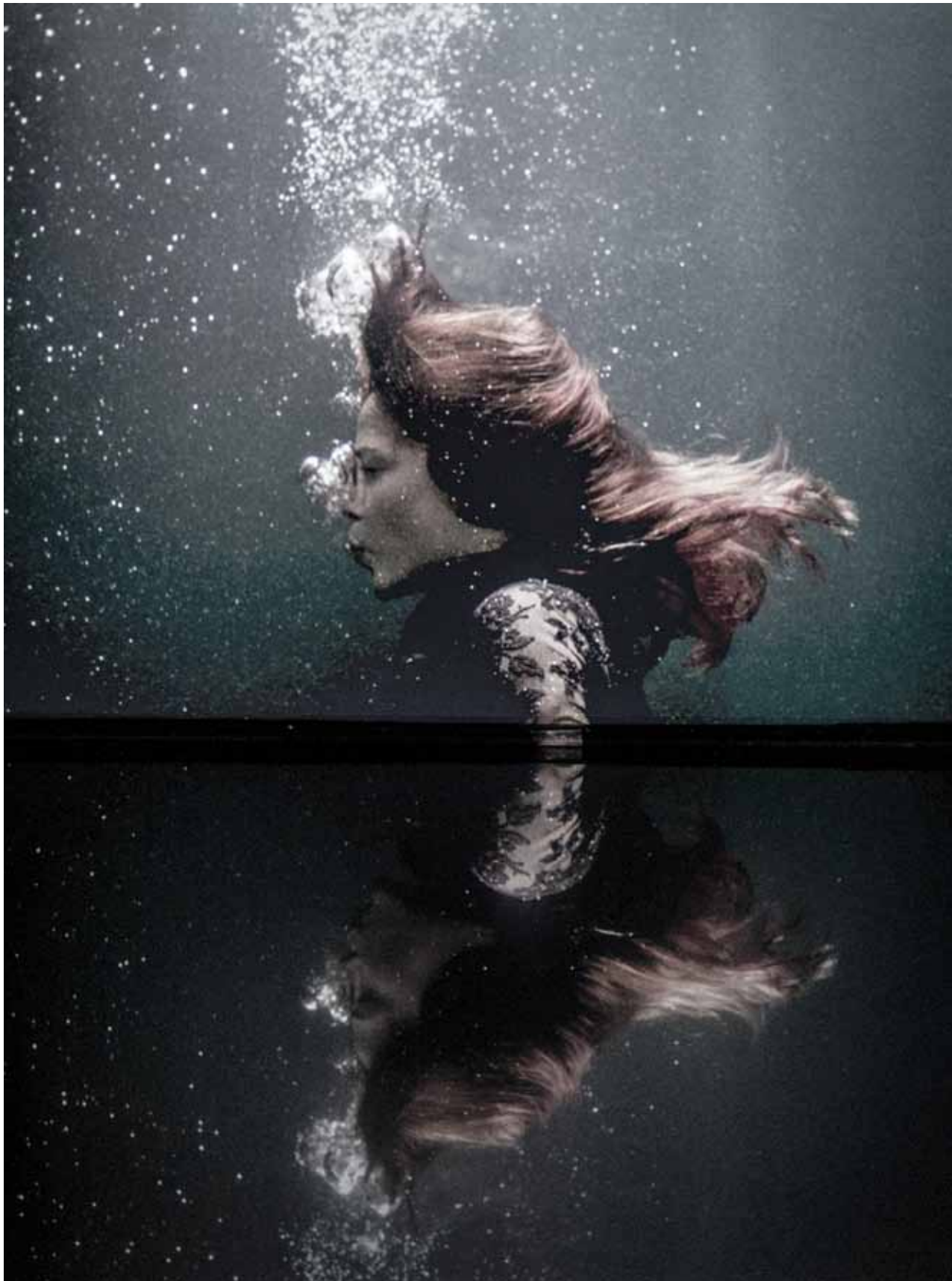
Dominique T. Skoltz, y2o, 2013. Projection vidéo avec bassin d'eau.