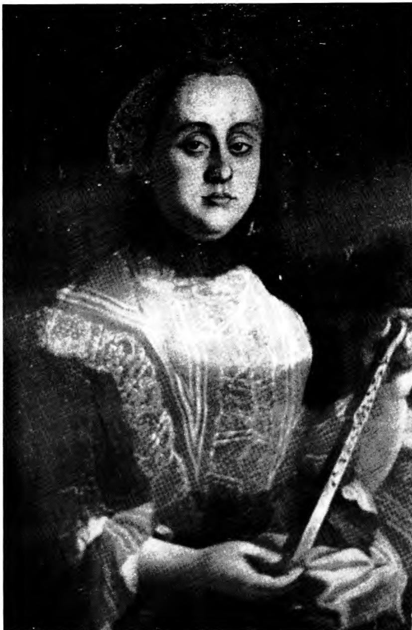
Figure 3: Portrait d'une dame vers le milieu du XVIII e siècle. Huile sur toile, non signée et non datée (Musée historique de Vaudreuil).