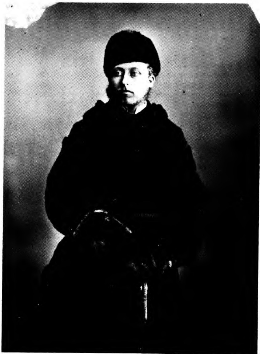
Figure 6: Le Duc de Connaught, gouverneur général du Canada, tel que photographié par l'atelier Notman en 1870. Ce dignitaire a revêtu pour l'occasion un costume "à la canadienne" composé d'un capot de grosse étoffe serré à la taille par une ceinture tricotée. Il est coiffé d'un bonnet de loutre et ses mains sont enmitoufflés par de volumineuses mitaines de peau d'ours.