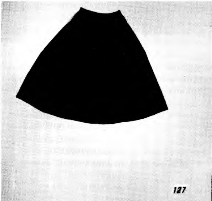
Figure 1: Cette jupe paysanne, datant au milieu du XIX e siècle, provient de Sainte-Croix, comté de Lotbinière. Elle fait parti de la collection Robert-Lionel Séguin composée uniquement de vêtements ruraux. Cette jupe est décorée de fines rayures noires rouges et blanches (pièce no 127, collection Robert-Lionel Séguin, Université du Québec à Trois-Rivières).

s'applique particulièrement bien au vêtement simple. Il est donc rarement entreposé, à l'opposé du vêtement de qualité, de prestige. Ce dernier fut en effet plus souvent conservé tout en ayant été celui qui fut le plus longtemps recherché. A notre connaissance, aucun vêtement datant du régime français n'est parvenu jusqu'à nous, hormis quelques ornements liturgiques. Rares sont également dans nos collections les vêtements canadiens antérieurs au premier quart du XIX e siècle. Après cette période, ils se font plus nombreux et consistent principalement en vêtements féminins et bourgeois. Figure d'exception la collection de Robert-Lionel Séguin conservée à l'Université du Québec à Trois-Rivières, composée surtout de vêtements ruraux datant de la fin du XIX e et du début du XX e siècles (Figure 1).