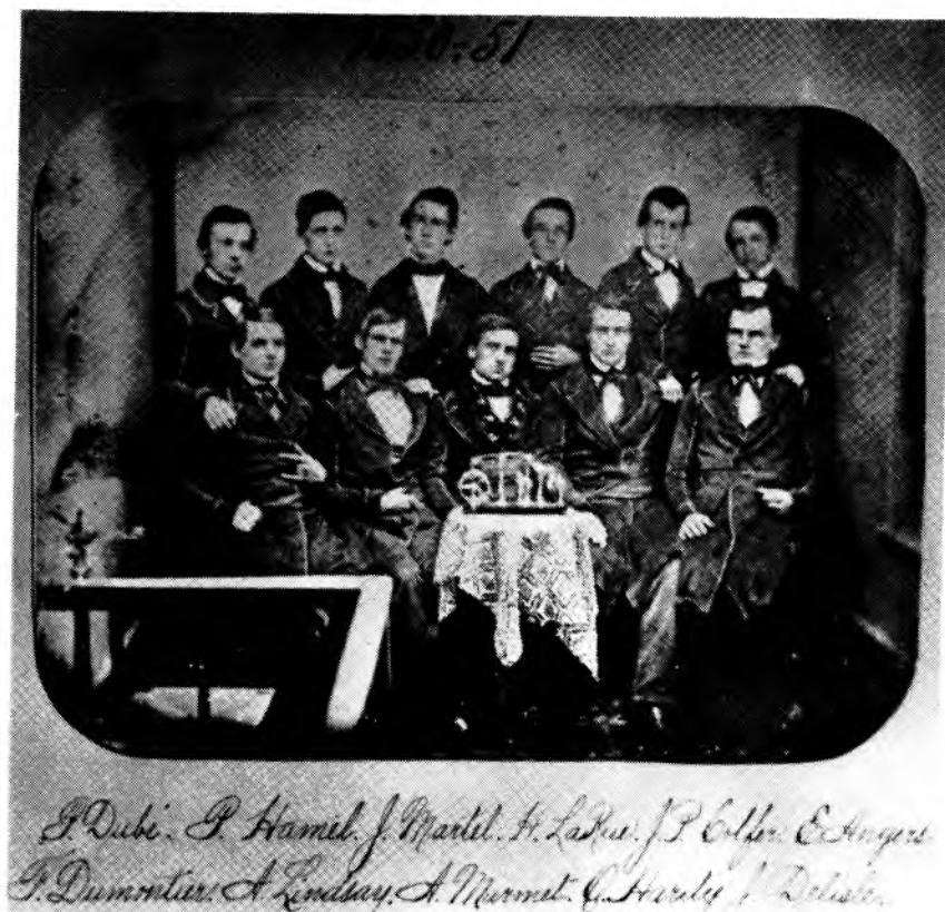
Figure 9: Ce groupe de finissants du Séminaire de Québec, photographié en 1851, porte le "costume d'écolier" composé principalement d'un capot bleu liseré de blanc serré à la taille par une ceinture verte. Les origines de ce costume remonte à 1668 et il ne sera abandonné dans cette institution qu'en 1949.