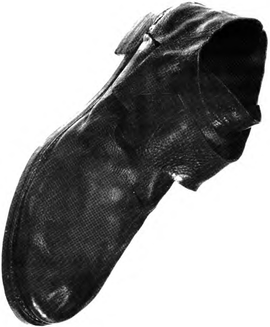
Figure 2: Voici une des quelques cinq cents chaussures provenant de l'épave du Machault, navire français coulé à Restigouche le 9 juillet 1760. Cette chaussure est un bon exemple du modèle de soulier porté tant par les civils que par les militaires au milieu du XVIII e siècle.