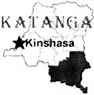
Carte situant le Katanga à l'intérieur de la RDC et présentée avec les nouvelles provinciales concernant cette région dans les bulletins de l'ACP.

Congolais, connaissant mal la géographie de leur pays, aient besoin de cartes pour situer les différentes régions de la RDC. On opposera toutefois à cet argument le fait que les Congolais qui ont accès au réseau Internet sont certainement beaucoup plus scolarisés que l'ensemble de la population et qu'il ne fait aucun doute que la large majorité de ceux-ci n'ont pas besoin d'une carte pour savoir où se trouve le Katanga ou la ville de Kinshasa. L'internaute moyen, un non-Congolais qui connaît peu l'Afrique, aura, lui, bien besoin pour s'y retrouver de ces cartes provinciales, voire même de celle qui situe la RDC à l'intérieur du continent africain et qui est présentée dans la page d'accueil du site du gouvernement.