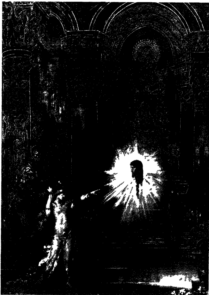
Gustave Moreau l'Apparition vers 1875 huile sur toile 142 x 103 cm Musée Gustave Moreau Paris

Gustave Moreau Salome 1876 huile sur toile 144 x 104 cm Collection Armand Hammer États Unis