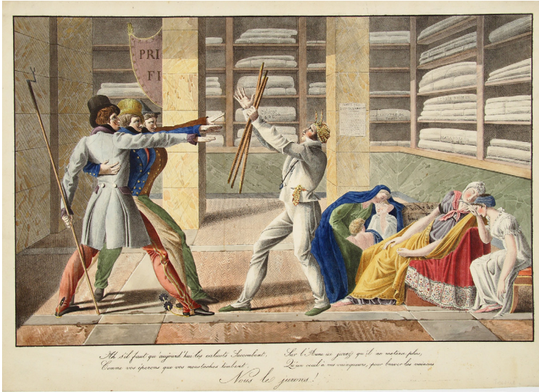
FIG. 5. [Serment des Calicots], chez Engelmann, lithographie aquarellée, 1817. Ottawa, Carleton University Art Gallery.

canonique des adieux d'Hector et Andromaque : Calicot s'élançait hors de sa boutique, demi-aune à la main, laissant sa compagne se morfondre derrière son comptoir. D'autres estampes réaffirment l'ascendant du paradigme antique en matière de représentation héroïque et virile telles que Le Gladiateur moderne (fig. 6), estampe parodiant le Gladiateur Borghese , par Pigal, parue chez Delpech et annoncée le 23 août, et Romulus Calicot , estampe parodiant le héros romain du tableau des Sabines de David, par Lasteyrie annoncée le 11 octobre. L'effet comique provient de l'écart entre cette grandeur, à la fois du modèle antique et artistique, et le ridicule des prétentions calicotières. Le Gladiateur moderne , par son titre, accentue la comparaison entre le passé antique et le présent moderne en convoquant une réflexion sur le changement de temporalités historiques. Quant à Romulus Calicot , l'exubérance de son costume contraste avec la nudité héroïque de conception davidienne et accentue le caractère artificiel de sa virilité.