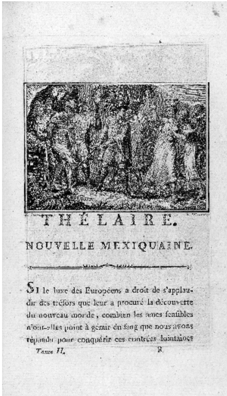
Figure 1b. Thélaïre. Nouvelle mexiquaine , vignette, dessins de Claude-Louis Desrais, gravés par Rémi-Henri-Joseph Delvaux, dans Louis d'Ussieux, Le Décameron françois , Paris, Brunet, 1775, t. 2, p. 245, Bibliothèque cantonale et universitaire de Lausanne.