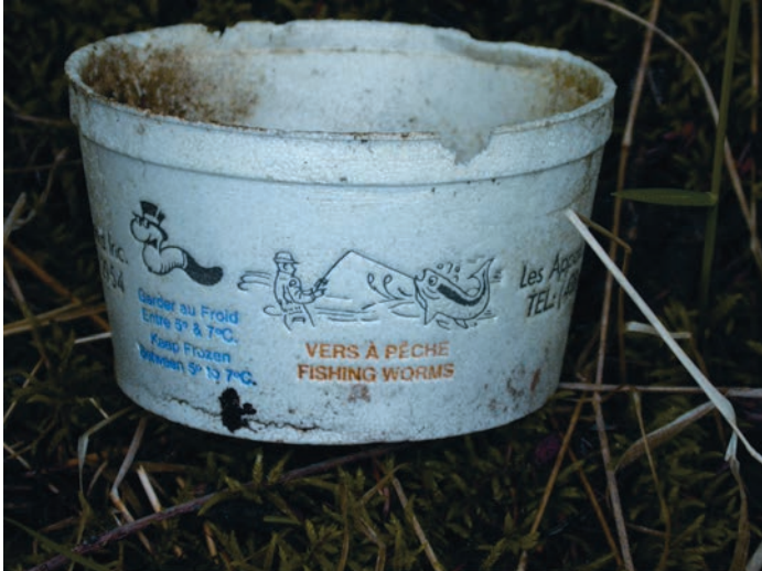
Figure 4. Contenants trouvés sur les sites d'étude et servant aux pêcheurs à transporter les vers de terre.

La migration « naturelle » des vers de terre, à la suite de leur introduction par les colons européens, ne peut expliquer leur présence dans les trois écosystèmes à l'étude et dans plusieurs régions où des mentions d'humus de type mull ont été faites. En effet, plusieurs études font état d'une migration annuelle maximale de 10 m pour les vers de terre ( van Rhee, 1969; Stockdill, 1982; Curry et Boyle, 1987; Marinissen et van den Bosch, 1992 ). En prenant en compte qu'il s'est écoulé environ 500 ans depuis l'arrivée des premiers colons dans la région de Québec, le déplacement possible maximum des vers de terre, depuis leur point d'introduction le long du fleuve Saint-Laurent, ne pourrait être que de 5 km. En fait , la pratique de la pêche sportive est la cause la plus probable pour expliquer la présence des vers de terre dans plusieurs de ces écosystèmes. En effet , les vers de terre sont souvent utilisés comme appât pour la pêche sportive. Des récipients contenant à la fois des vers et des cocons sont souvent abandonnés ou vidés en bordure des lacs par les pêcheurs. D'ailleurs , de tels récipients ont été trouvés par l'auteur principal dans chacun des trois secteurs échantillonnés (figure 4).