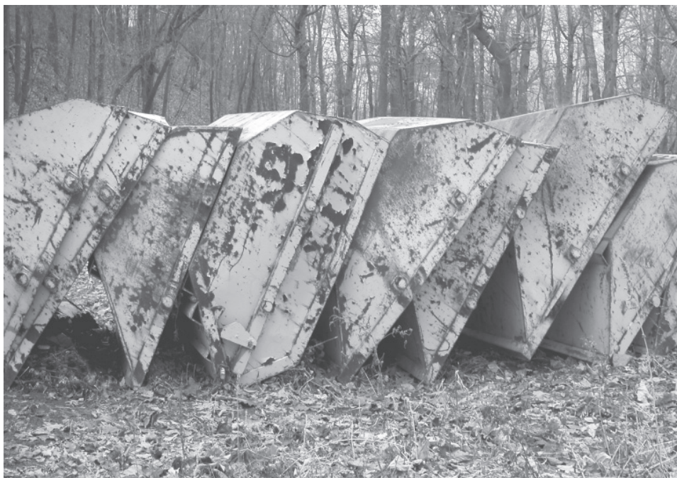
André Clément, Pelles

L'intérêt porté au mode de suicide utilisé est ancien, notamment pour prévenir la contagion suicidaire. Il y eut des exemples célèbres : à l'hôtel des Invalides, à Paris, il y avait un crochet sous la voûte d'un passage et plusieurs dizaines de personnes s'y pendirent jusqu'à ce qu'on le supprime. Certains sites semblent avoir été conçus comme des lieux pour se suicider. Par exemple, le pont Golden Gate à San Francisco constitue le site où il y a le plus de suicides parmi tous les sites au monde. Il y a à San Francisco d'autres ponts qui ont un accès aussi facile et qui sont aussi dangereux. Cependant, il est rare qu'on rapporte un suicide sur un autre pont. Le Golden Gate est conçu comme l'endroit où l'on doit se tuer. Dans la ville de Washington, le pont Duke Ellington était connu comme un endroit pour se suicider. À quelques centaines de mètres de ce pont, il y en a un autre aussi élevé. Peut-être à cause de la publicité, on ne rapportait presque jamais de suicide sur l'autre pont, tout le monde utilisait le pont Duke Ellington. À la suite d'une campagne de prévention du suicide, on a construit une barrière pour empêcher les personnes de sauter du pont Duke Ellington, mais on n'a ajouté aucune barrière aux autres ponts de la ville. Cela a complètement éliminé les suicides au pont Duke Ellington et le nombre de chutes des ponts a diminué significativement, sans qu'on note une augmentation des chutes à partir d'autres ponts de la région. De nombreux autres exemples pour-