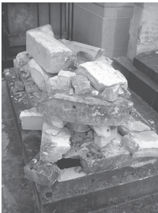
André Clément, Sépulture 8

La mortalité relative aux toxiques psychotropes est inférieure à 1 % alors que pour les toxiques cardiotropes, elle s'élève à près de 4 %, ce qui reste nettement inférieur à la mortalité observée avec les pesticides, les