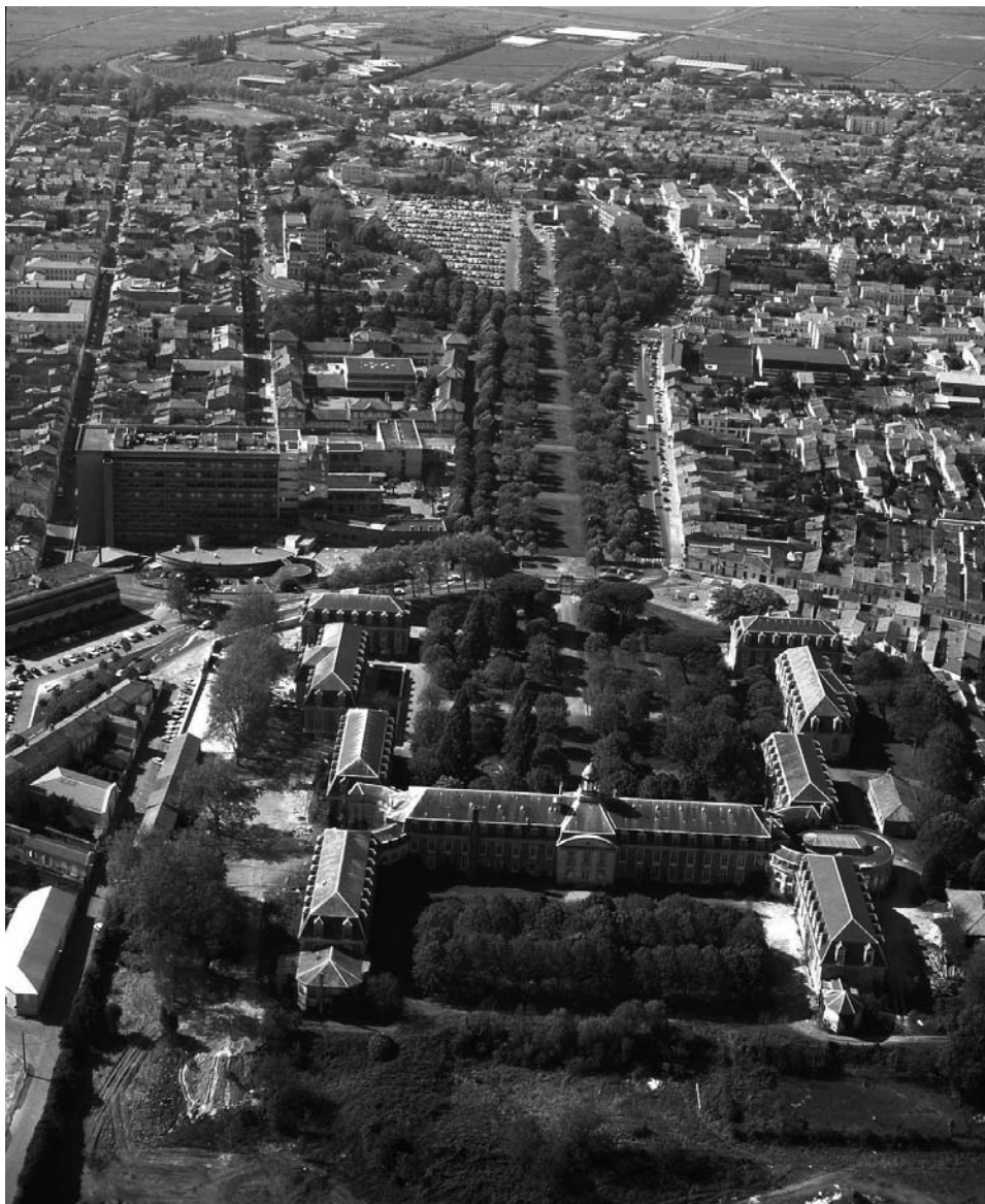
Vue aérienne de l'hôpital maritime de Rochefort

Mais la qualité du matériel ne représente que le versant technique de la relation cognitive entre le praticien et le cadavre. En effet, dresser un registre d'autopsies dans lequel différents chirurgiens et démonstrateurs consignent leurs observations implique certaines conventions sémantiques et des procédés rhétoriques qui soient intelligibles pour l'ensemble de la communauté médicale de l'hôpital (Delmas et al. , 2000, p. 219-232). Or, la