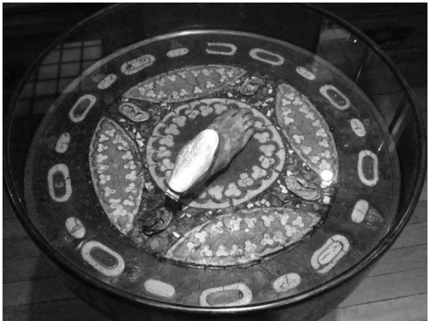
FIGURE 3 EFISIO MARINI, PETITE TABLE.