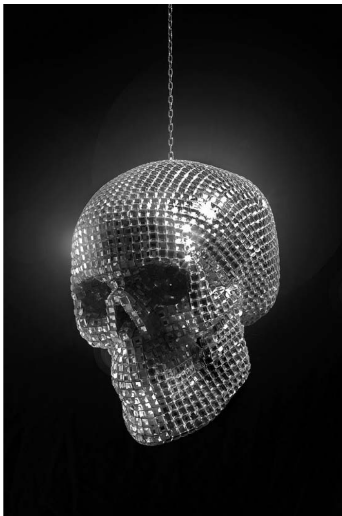
Christoph Steinmeyer, Disco Inferno , 2002, miroir, composantes mécaniques, 18 x 20 x 15 cm.

Ici, dans les productions actuelles présentées, la Vanité met en évidence le crâne, mais le traitement diffère. Souvent montré seul, il est pailleté, mis en valeur par sa brillance. Orné tel un bijou, il se proclame vaniteusement, ne renvoyant qu'à lui-même. Parmi quelques exemples, l'artiste allemand Christoph Steinmeyer