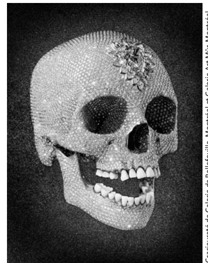
Damien Hirst, For the Love of God, Laugh , (détail) 2007, sérigraphie avec glacis et poussière de diamant sur papier, 100 x 75 cm.