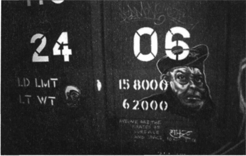
FIGURE 6 OTHER A INSCRIT EN DESSOUS DU VISAGE : • AYE, WE ARE THE/PIRATES OF/SURFACE/AND SPACE •