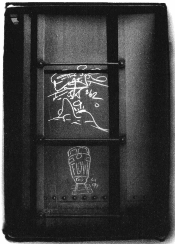
FIGURE 4 SOLO ARTIST, 02/2002 (DATÉ 07/1995) FLOW, 04/1999