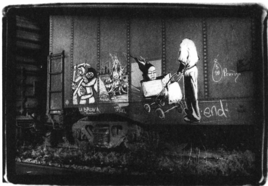
FIGURE 8 LABRONA ET END (2002)