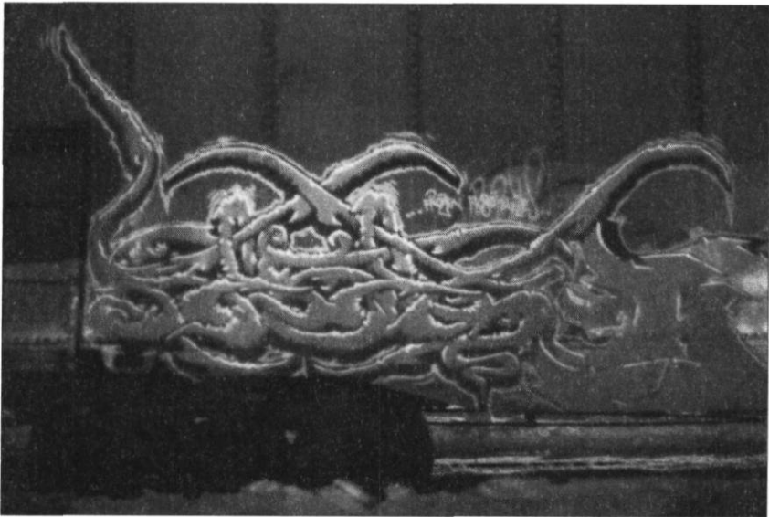
FIGURE 2 UNE PIÈCE TRÈS COMPLEXE EXÉCUTÉE PAR RESET (QUI FAIT AUSSI PARTIE DU GROUPE FROZEN FR8OPHILES)