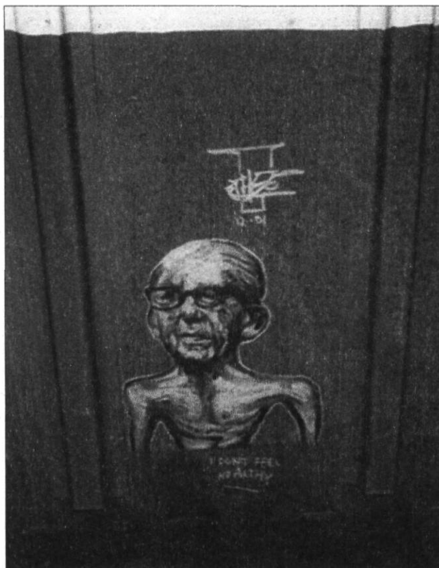
FIGURE 5 SOUS SON MONIKER (DATÉ DU 12/2001) OTHER A INSCRIT : « I DON'T FEEL HEALTHY »