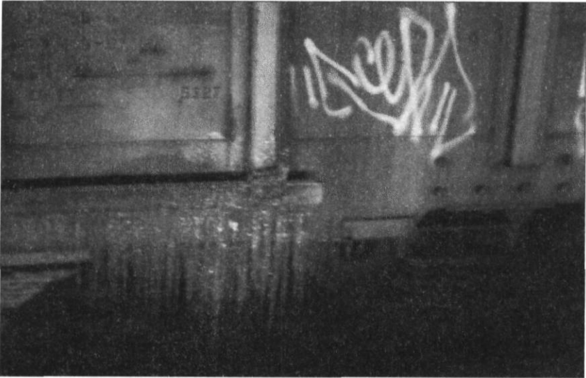
FIGURE 1 UN TAG PAR UN GRAFFITEUR INCONNU