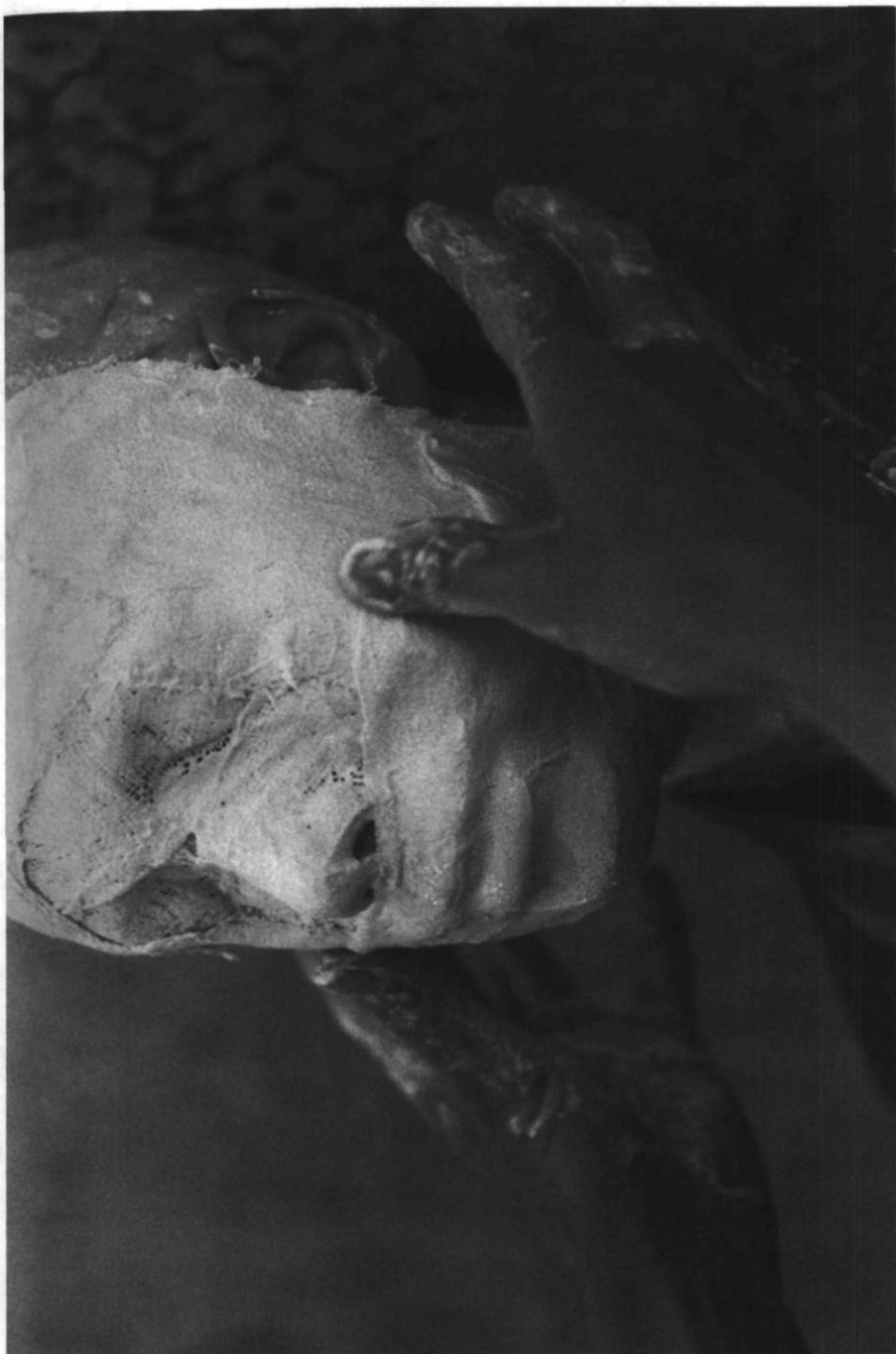
Confection d'un masque pour Les aveugles