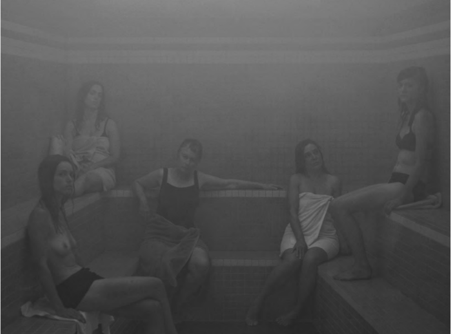
Olivia Boudreau, images tirées de L'Étude , 2011, durée : 20 min.