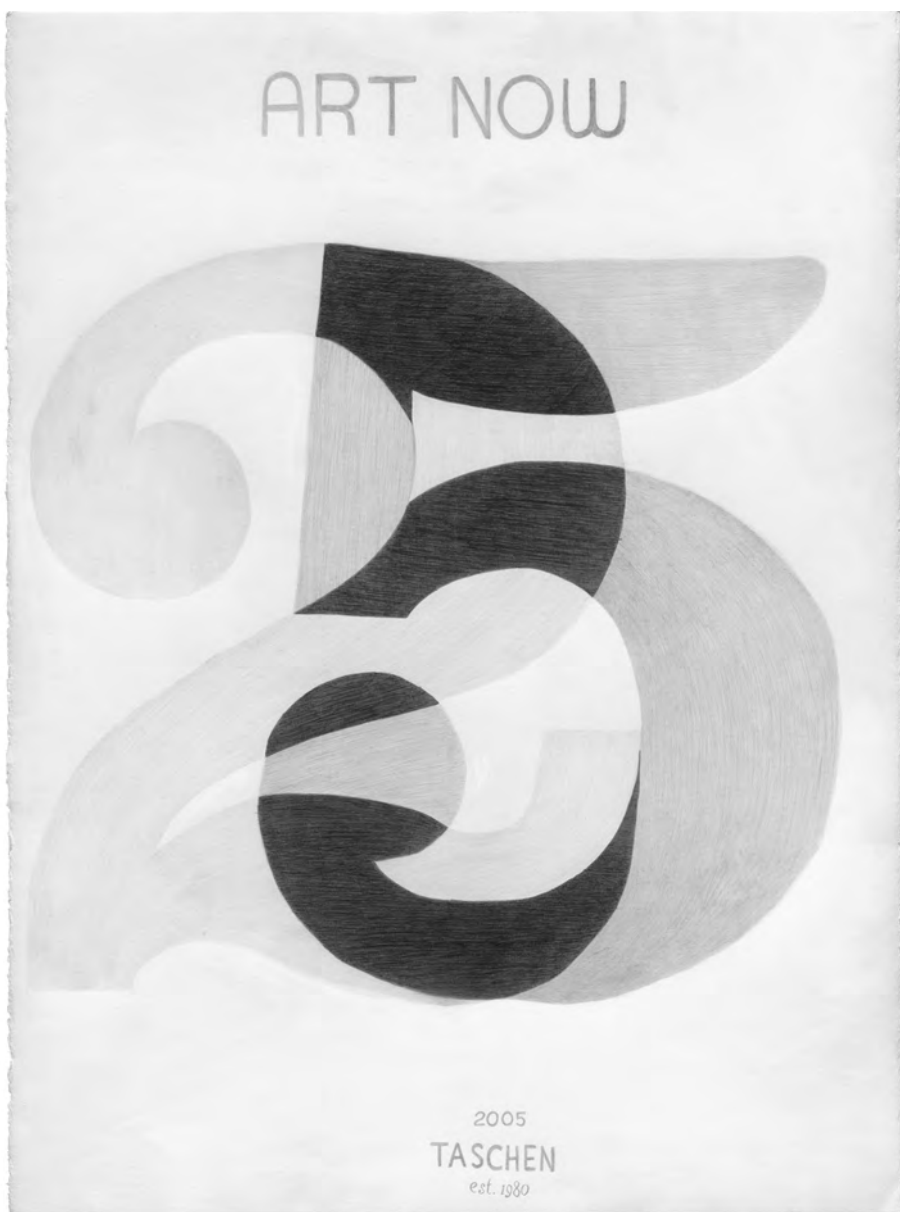
Thérèse Mastroiacovo, Art Now (2005 à ce jour) , 55,9 cm × 76,2 cm, graphite sur papier, séries/itérations : plus de 100 dessins à ce jour. Art Now (Art Now, 2005) , 2008. Collection de la Galerie Leonard & Bina Ellen, Université Concordia, Achat, 2011.