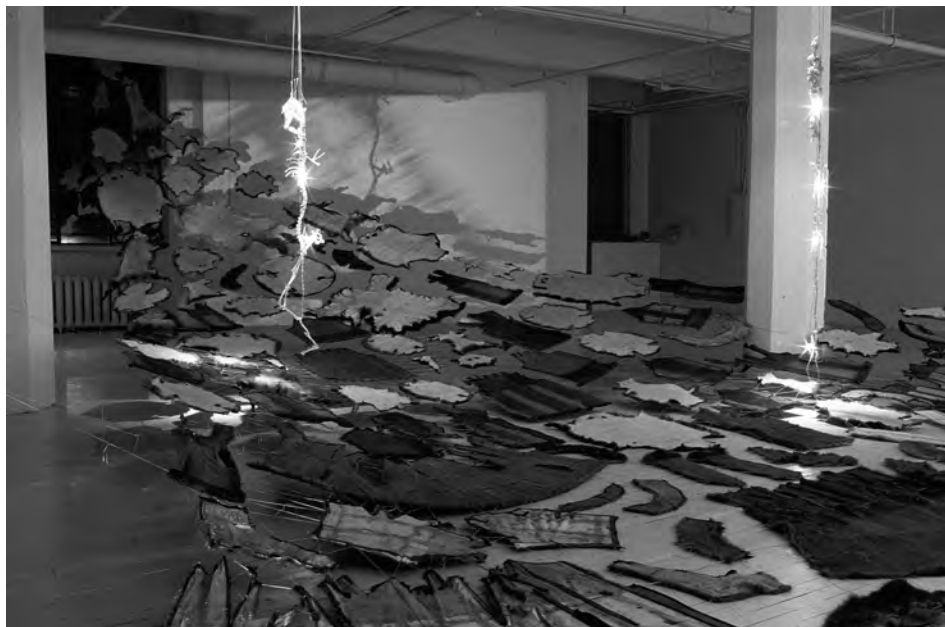
Sonia Robertson, Dialogue entre Elle et moi à propos de l'Esprit des animaux , 2002, installation in situ dans l'espace du centre Skol (peaux d'animaux, manteaux, ossements, diapositives, son).