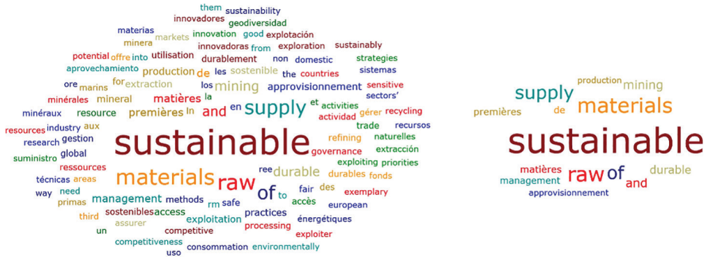
Figure 2. Variantes autour de la formule émergente « sustainable supply »