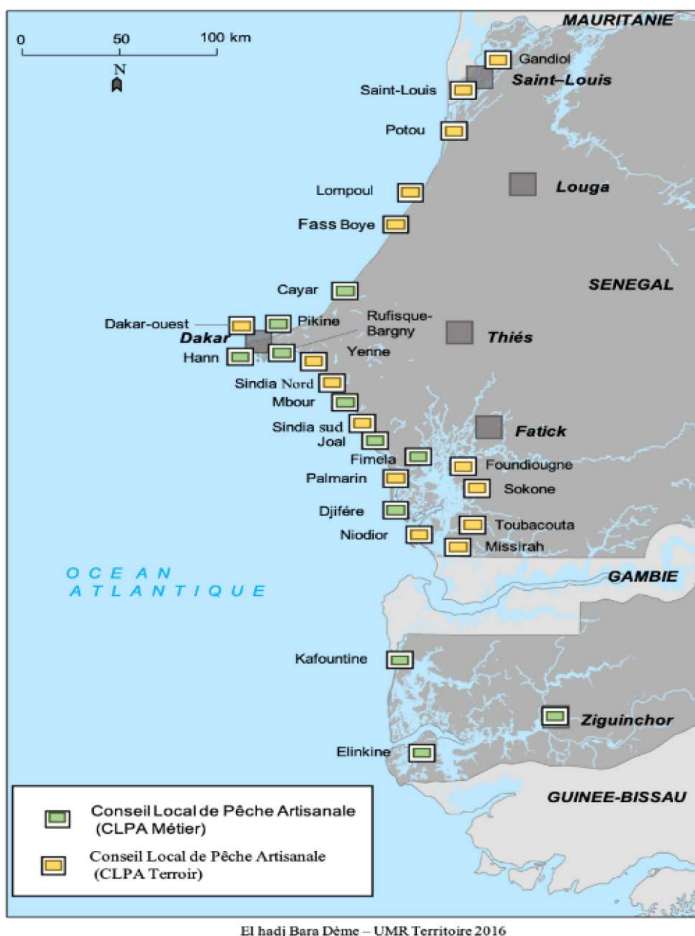
Figure 2. Distribution le long du littoral sénégalais des 27 conseils locaux de pêche artisanale mis en place par le gouvernement et les acteurs locaux de 2004 à 2018